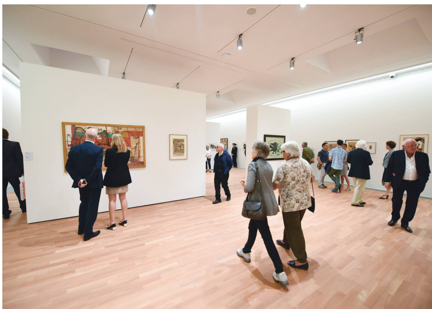
Le musée attire également de nombreux visiteurs qui n'habitent pas au Tessin.