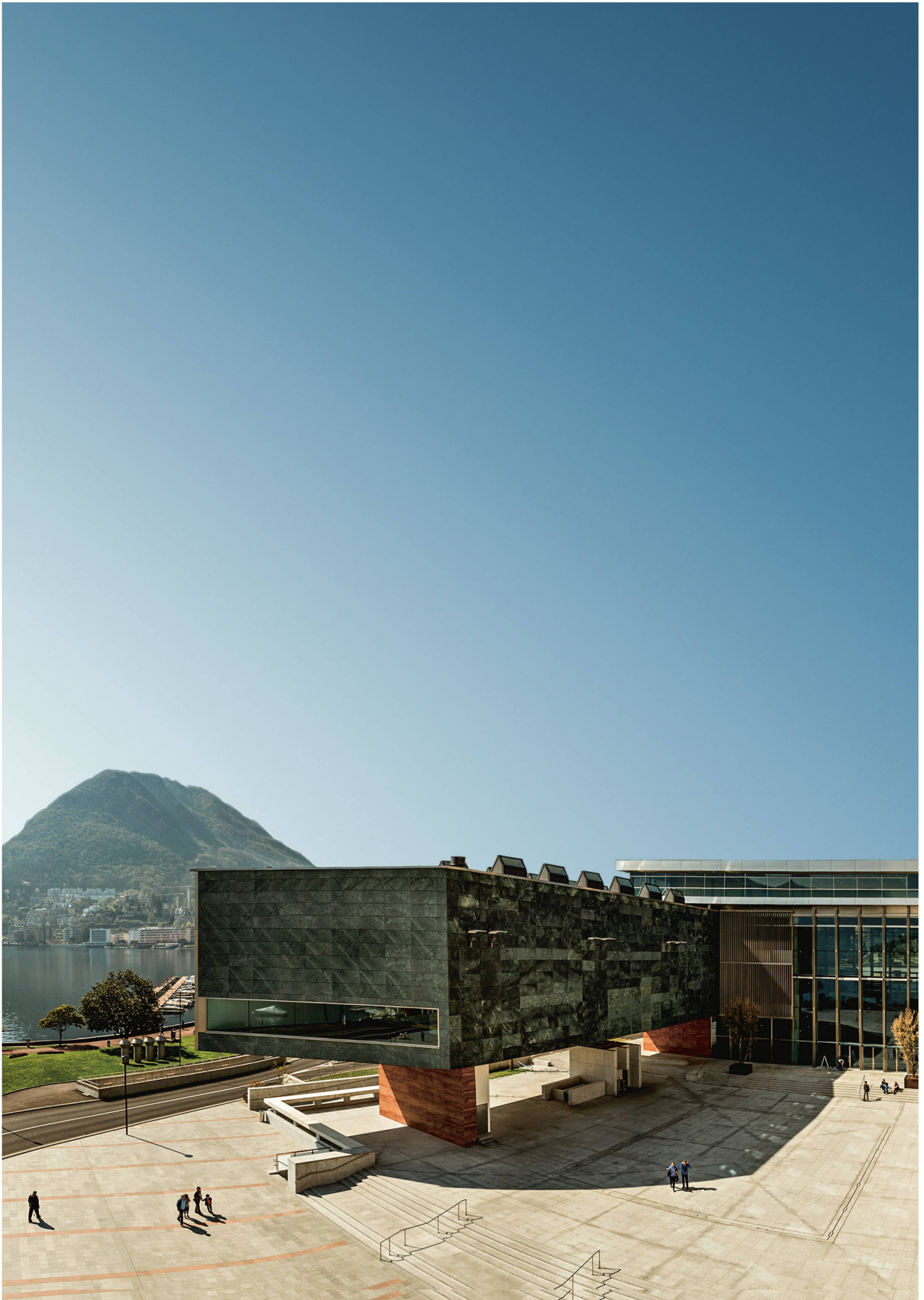
Le LAC confère à Lugano une dimension internationale.