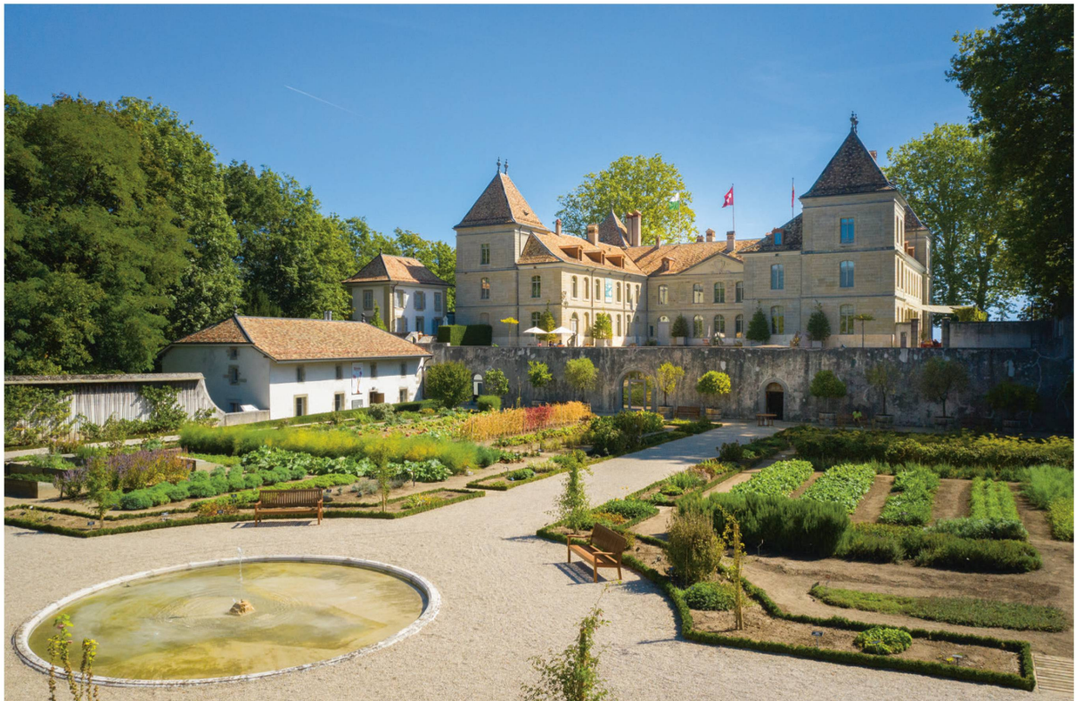
Blick auf das Areal Prangins: Schloss und Gemüsegarten.