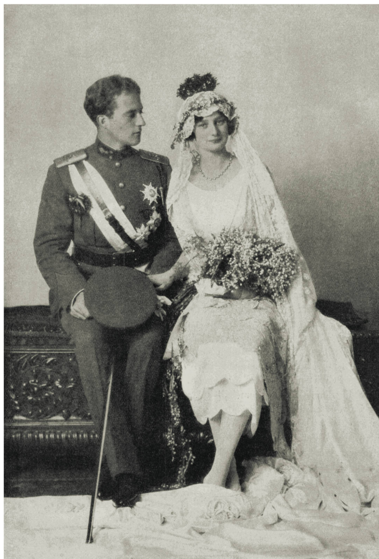
Leopold III. von Belgien heiratet 1926 die 19-jährige Astrid von Schweden.