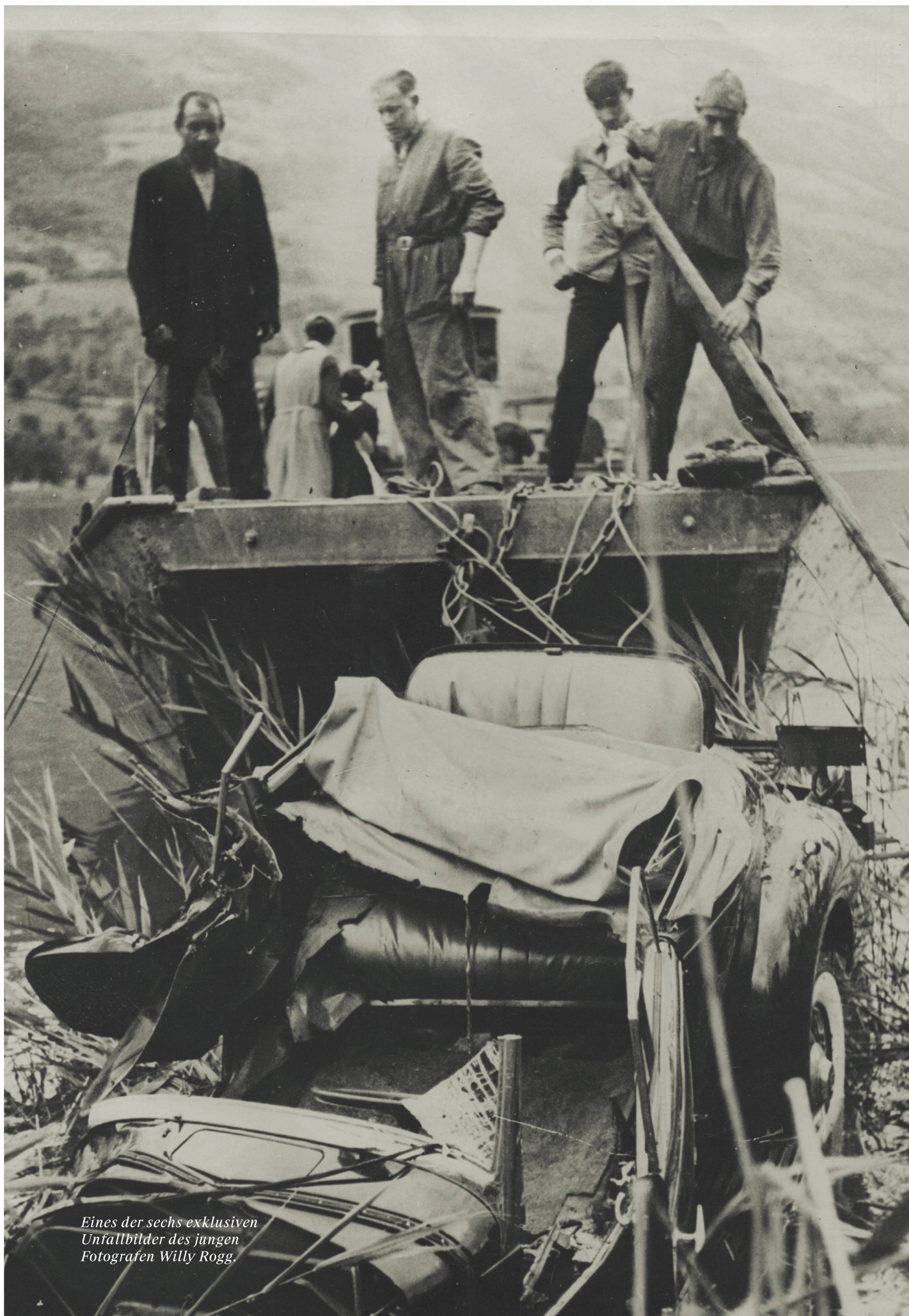
Eines der sechs exklusiven Unfallbilder des jungen Fotografen Willy Rogg.