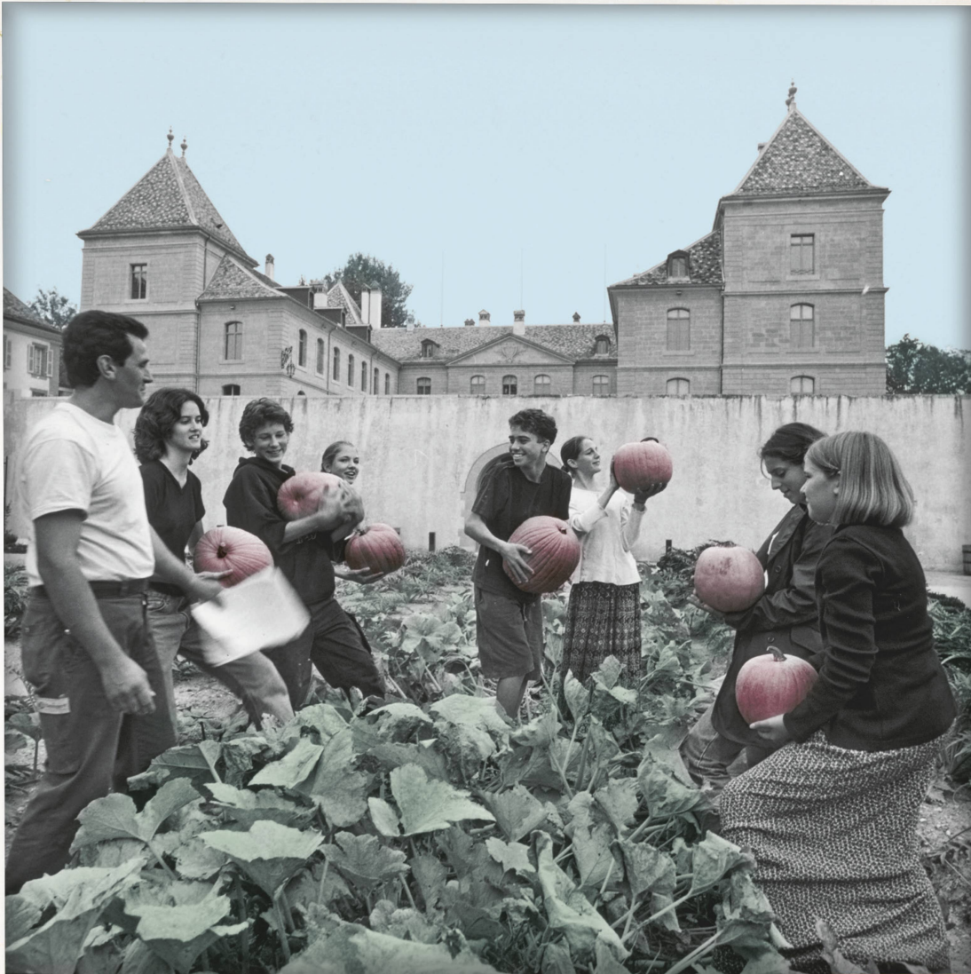
Ernte im Garten des Château de Prangins, 1997.