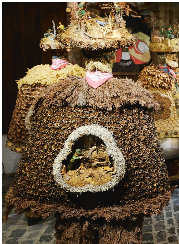
Für die Hauben der «schöne Chläus» wurde z. T. Weihnachtsschmuck verarbeitet; für die Kostüme der «schö-wüeschte» Materialien wie Reisig oder Tannzapfen.

«Highlights» im Appenzeller Kalender mit Einblicken in das einstige Alltagsleben der ländlichen Bevölkerung. Schliesslich sind die – allerdings vielleicht sichtbarer – Bräuche nicht in einem neutralen Raum entstanden, sondern wurzeln in den Lebensgewohnheiten und im Handwerk der Menschen. Dieses findet deshalb in Form einer Bauernstube, einer Sennenkammer oder einer Werkstatt ebenfalls seinen Platz im Brauchtumsmuseum Urnäsch.