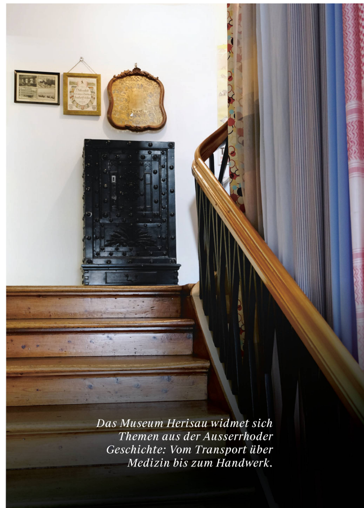
Das Museum Herisau widmet sich Themen aus der Ausserrhoder Geschichte: Vom Transport über Medizin bis zum Handwerk.