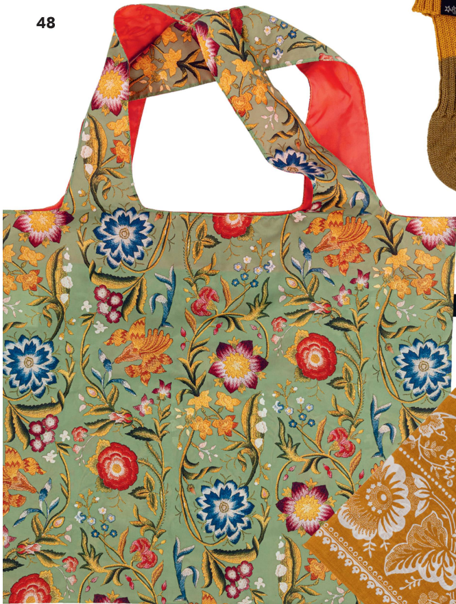
Tasche faltbar: Blumenmuster Aus der Sammlung Schweizerisches Nationalmuseum, Loqi «limited edition»/CHF 18.50