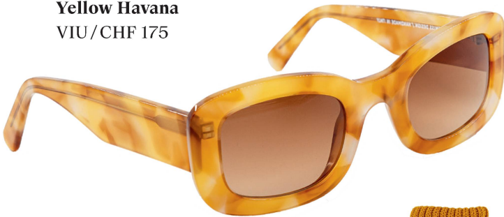
Sonnenbrille: The Posh Yellow Havana VIU/CHF 175