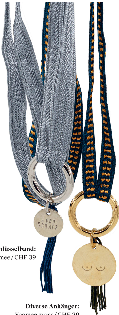
Schlüsselband: Yoomie / CHF 39