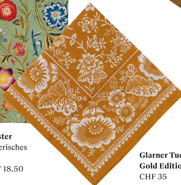
Glarner Tuch: Gold Edition CHF 35