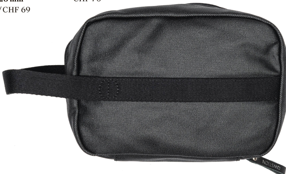
Toiletry Kit: Jet Black Qwstion, 23 x 15 x 7 cm CHF 70