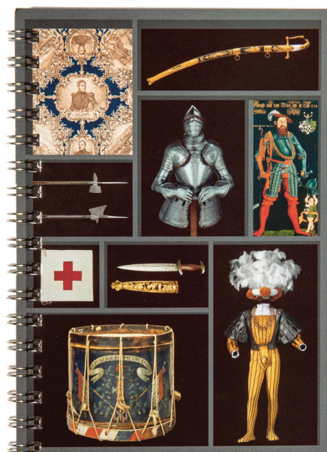
Notizbuch: Geschichte Schweiz Edition Schweizerisches Nationalmuseum / CHF 4.90