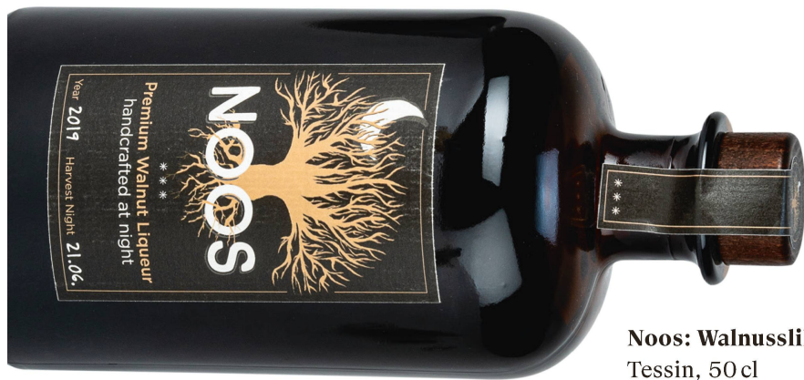
Noos: Walnusslikör Tessin, 50 cl CHF 56

Schöne Sachen findet man im Landesmuseum Zürich nicht nur in den Ausstellungen, sondern auch in der Boutique – und vielleicht bald schon bei sich zuhause.