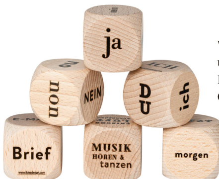
Würfel: Ja oder nein und weitere Texte Fidea Design CHF 13