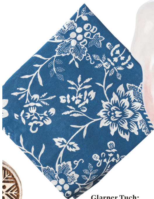
Glarner Tuch: Edition Landes- museum 60×60 cm / CHF 33