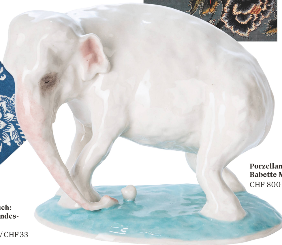
Porzellanfigur: Babette Mäder CHF 800