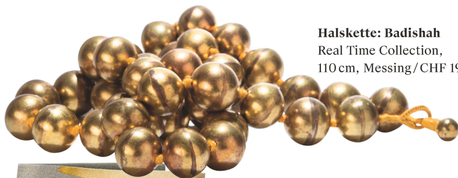
Halskette: Badishah Real Time Collection, 110 cm, Messing / CHF 198