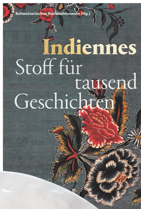
Buch: Indiennes Stoff für tausend Geschichten Schweizerisches Nationalmuseum, 140 Seiten / CHF 36