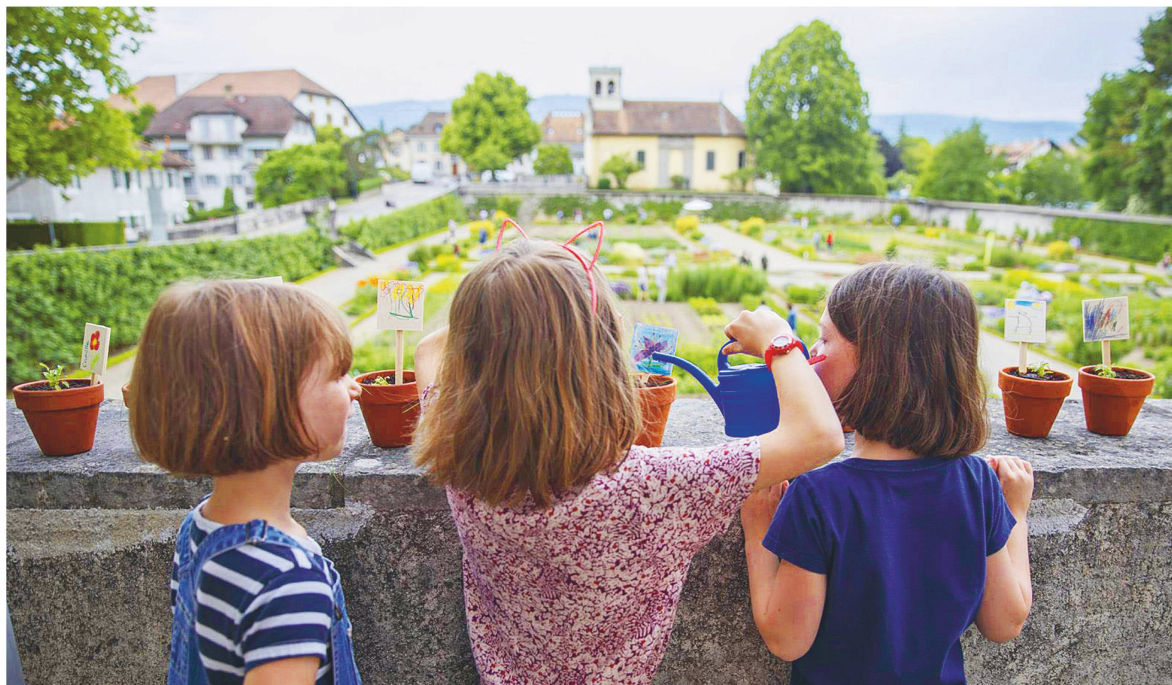
Auch kleine Besucher werden am Rendez-vous au jardin bestens unterhalten.