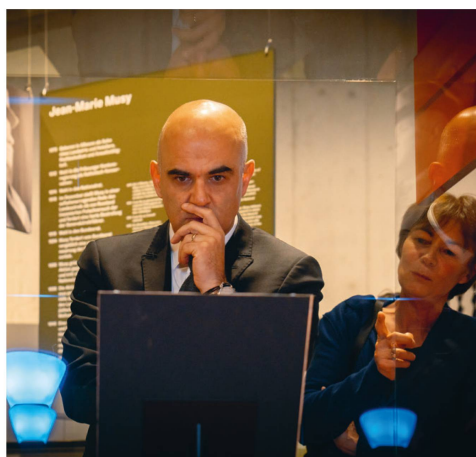
Bundesrat Alain Berset eröffnete im November die Ausstellung «Landesstreik 1918» im Landesmuseum Zürich.

Persönlichkeiten, die in jüngster Zeit das Schweizerische Nationalmuseum besucht haben.