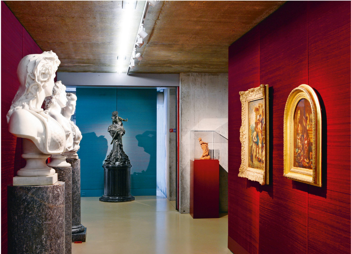
Die Bildhauerin Adèle d'Affry, bekannt als Marcello, hinterliess dem Museum einen Teil ihrer Werke.