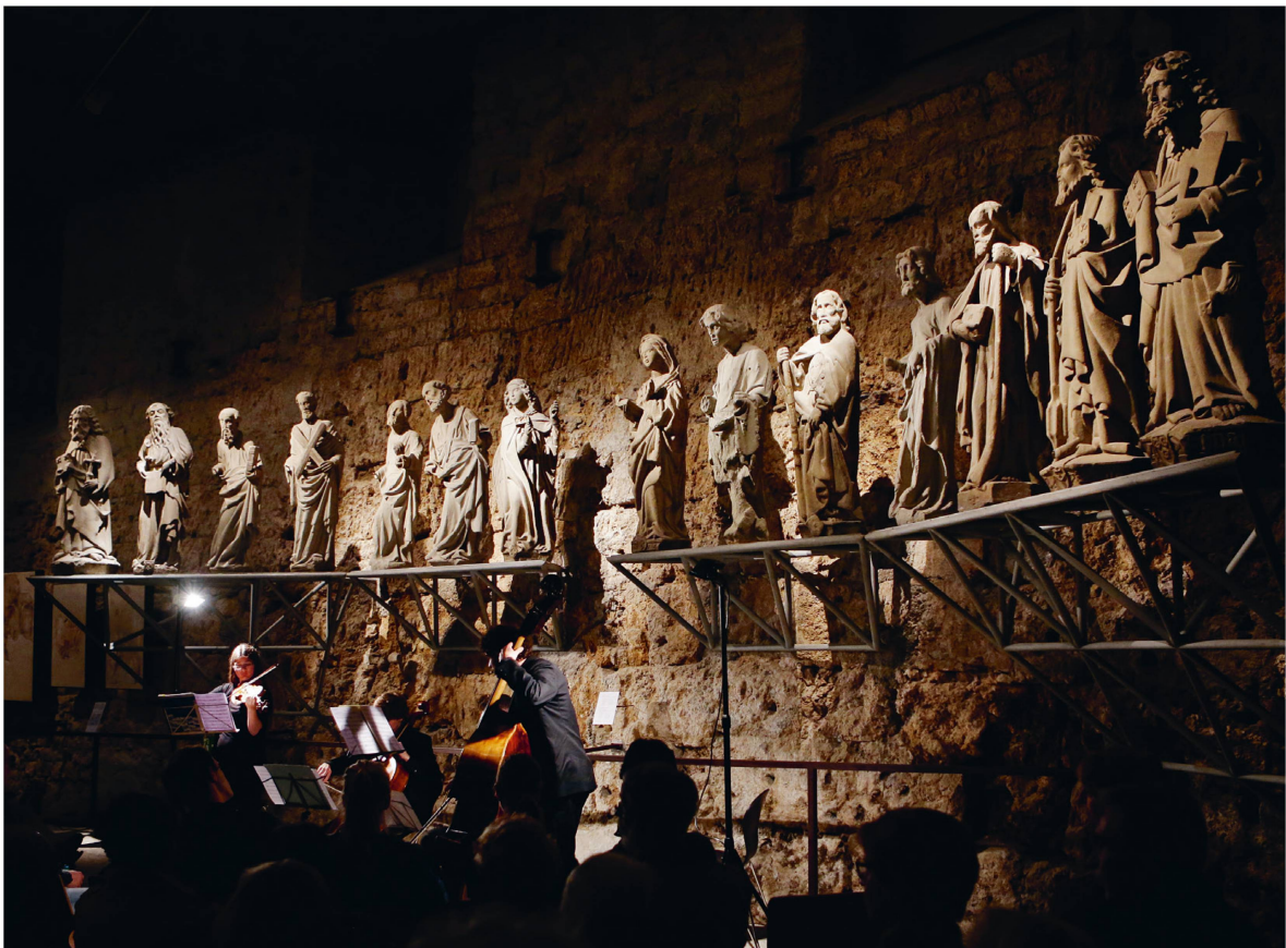
Bei Veranstaltungen im Lapidarium werden die Steinstatuen zum stillen Publikum.