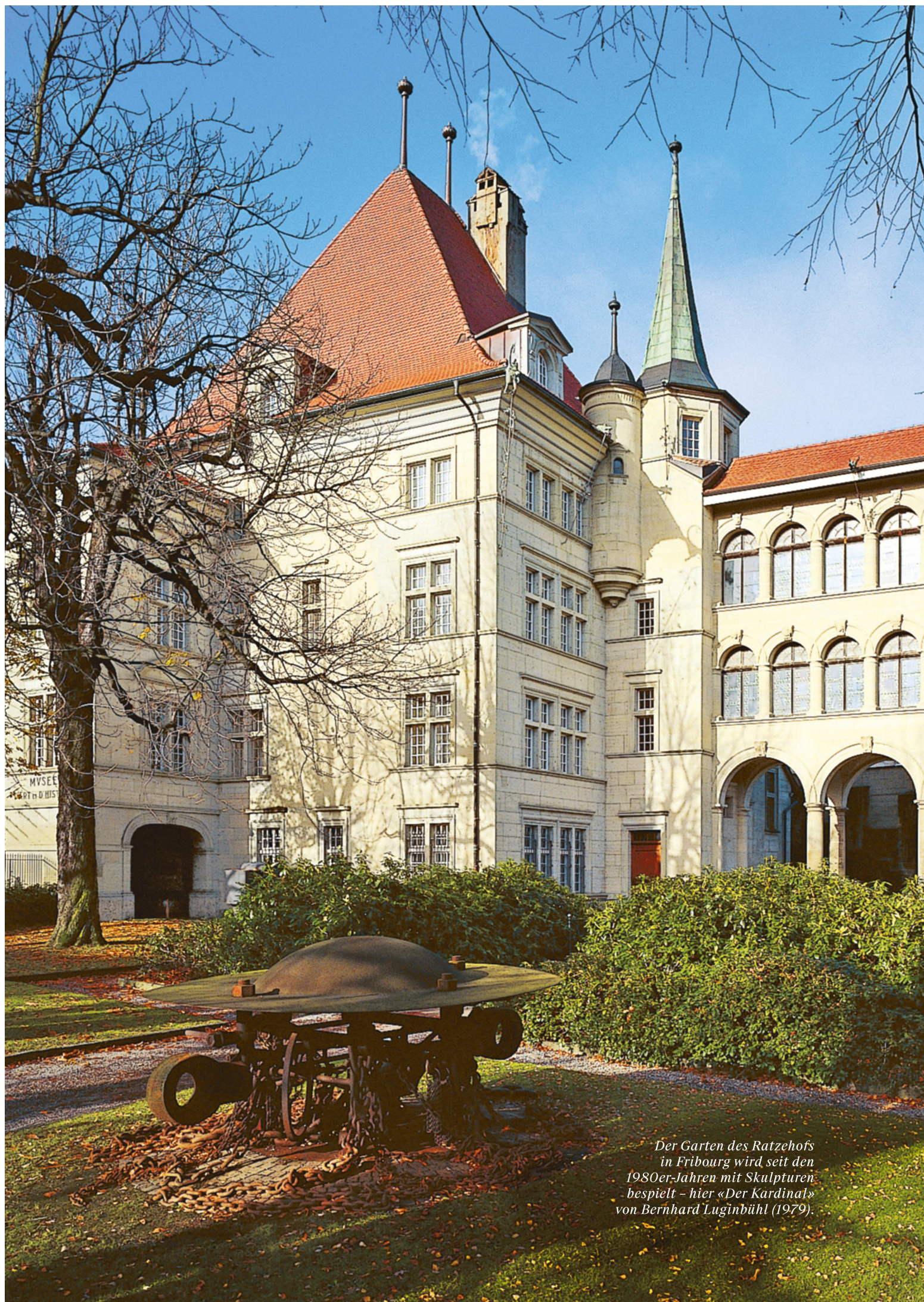
Der Garten des Ratzehofs in Fribourg wird seit den 1980er-Jahren mit Skulpturen bespielt – hier «Der Kardinal» von Bernhard Luginbühl (1979).