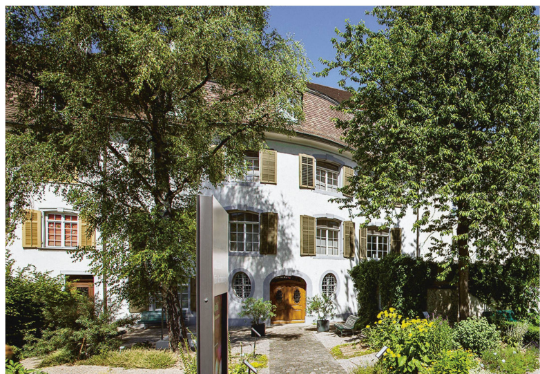
Das Museum ist im 1771 gebauten Luzernerhaus beheimatet.

So findet man sich vor einem prall gefüllten Abfalleimer wieder, aus dem Spatzen Essensreste picken, oder schaut in einen Estrich hinein, der nicht nur Fledermäuse beherbergt. Eindrück-