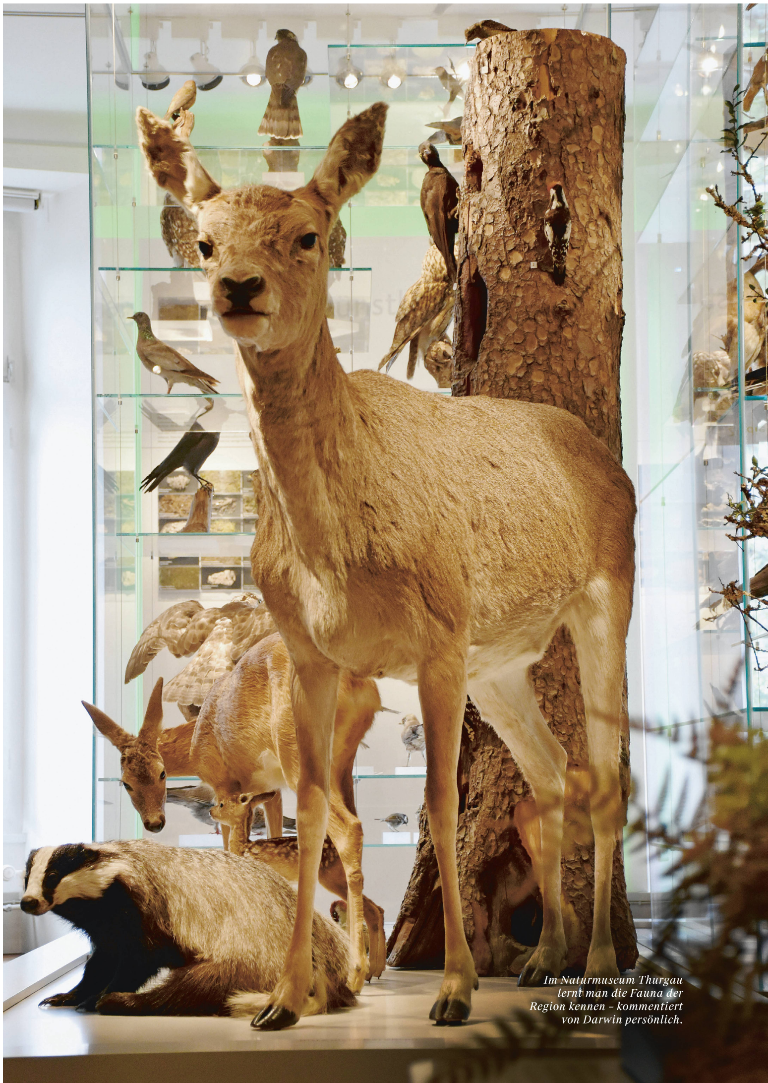
Im Naturmuseum Thurgau lernt man die Fauna der Region kennen – kommentiert von Darwin persönlich.