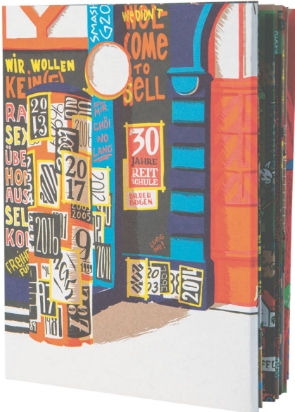
Publikation: 30 Jahre Reitschule Bern

Abteilung Zukunft, kartonierter Einband, 64 Seiten / CHF 37.50