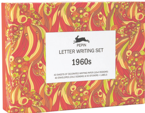
Letter Writing Set: 1960s Pepin / CHF 30.50