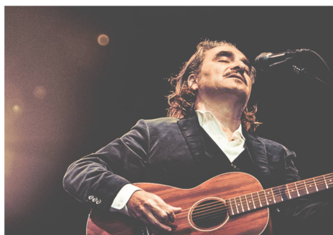
Stephan Eicher verzauberte im Frühsommer das Publikum im Innenhof des Landesmuseums.

Der Diplomat und Politiker Tim Guldemann ist neuer Präsident des Museumsrats des Schweizerischen Nationalmuseums.