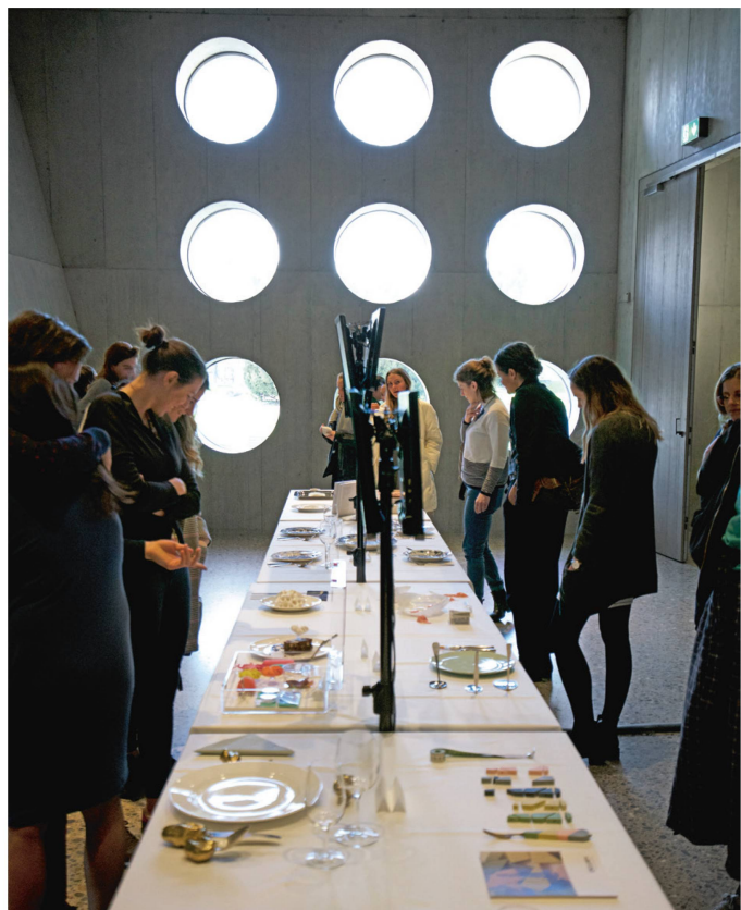
Am Fokustag «Auf der Suche nach dem Stil – damals und heute» stellten sich junge Gestalterinnen und Gestalter Fragen nach Stilbewegungen und deren Inspiration.