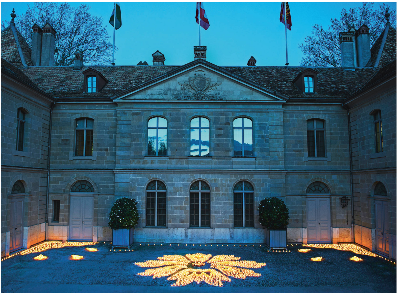
Der Probendurchlauf vom 21. April lieferte einen Vorgeschmack auf das geplante Lichtspektakel.

Zum 20-jährigen Jubiläum des Westschweizer Sitzes des Nationalmuseums beleuchtet der Lichtkünstler Muma den Garten des Château de Prangins.