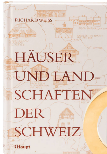
Buch: Häuser und Landschaften der Schweiz Richard Weiss, Haupt Verlag, 2017 / CHF 38