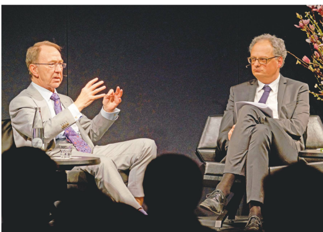
Im März gastierte Sir Ian Kershaw (links) im Landesmuseum. Der Brite gehört zu den weltweit renommiertesten Historikern.

Chris Dercon, ehemaliger Chef der Tate Modern in London und designierter Direktor der Volksbühne Berlin, fordert ein Museum für alle.