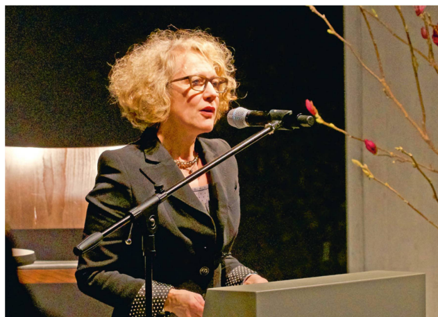
Corine Mauch wünscht sich eine Stadt, die sich international als Kunst- und Kulturdestination etablieren kann. Das sagte die Zürcher Stadtpräsidentin an einer Diskussion im Landesmuseum.