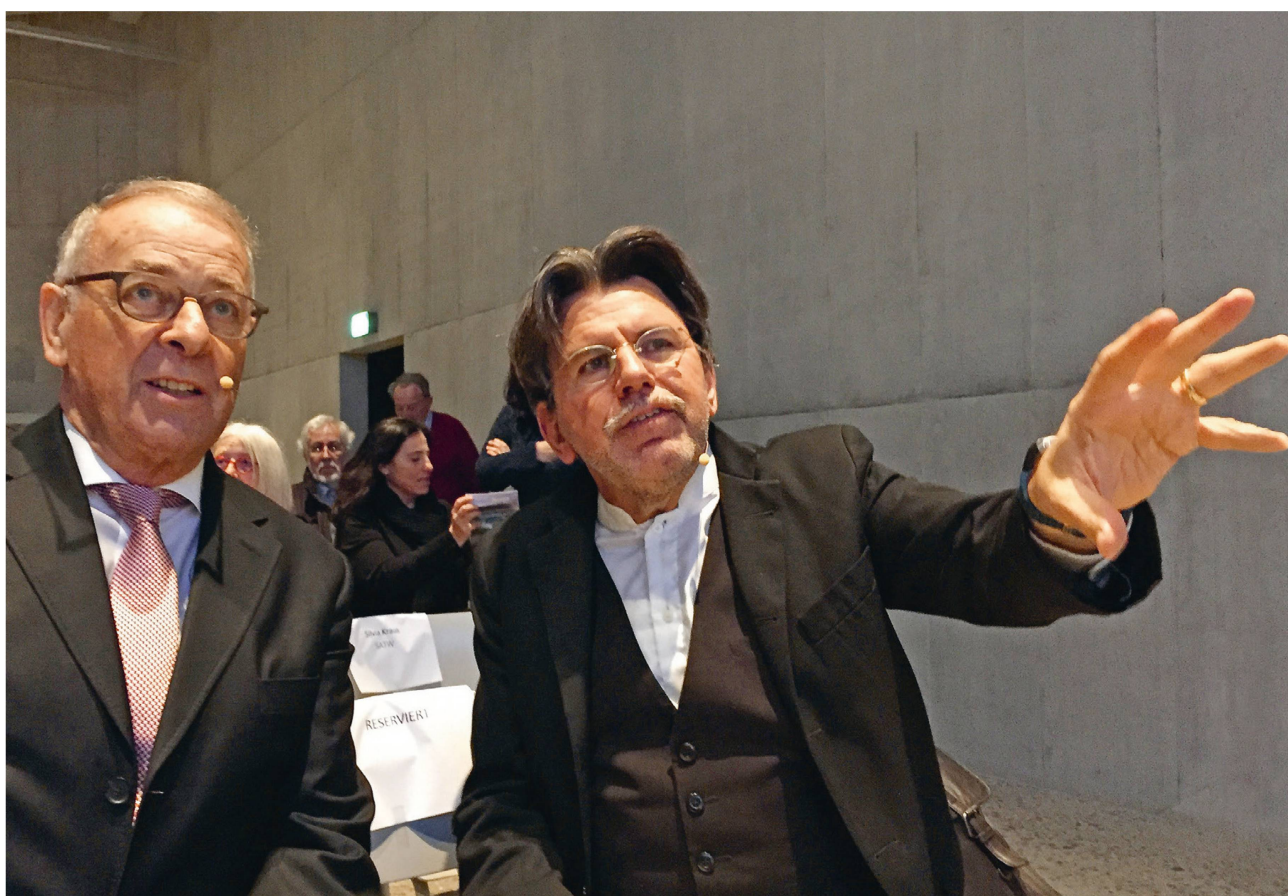
Alt-Bundesrat Adolf Ogi (links) und TV-Legende Stephan Klapproth (rechts) diskutierten im Februar im Landesmuseum über ein Schweizer Monument: den Gotthard.