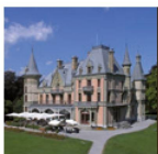
Schloss Schadau Die Perle am Thunersee

Das Schloss Hünegg in Hilterfingen wurde 1861 nach Vorbildern der französischen Loire-Schlösser erbaut. Sein Jugendstil-Interieur ist seit 1900 unverändert geblieben. Sonderausstellung 2016: «Delightful Horror» – Die Erhabenheit der Alpen und der frühe Fremdenverkehr.