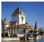
Schloss Oberhofen Magie aus acht Jahr- hunderten

Schloss Spiez und die romanische Schlosskirche liegen auf einer kleinen Halbinsel, umgeben von Thunersee und Bergen. Die neue Dauerausstellung gibt Einblick in die 1300jährige Geschichte. Sonderausstellung 2016: «Ernst Ludwig Kirchner: Dresden – Berlin – Davos».