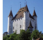
Schloss Thun Das Museumsschloss

Im romantischen Schloss Oberhofen wird Geschichte aus acht Jahrhunderten erlebbar. Der weitläufige Park direkt am See lädt zum Verweilen ein. Sonderausstellungen 2016: «Schlossräume und Schlossträume», «Mythos Orient – Ein Berner Architekt in Kairo».