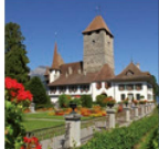
Schloss Spiez Geschichte und Kunst

Die unvergleichliche Lage am Wasser, eine atemberaubende Aussicht. Beste Küche und herzlicher Service vom Frühstück bis zum Abendessen. Die Geschichte der Gastronomie dargestellt im Gastronomiemuseum.