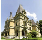
Schloss Hünegg Das märchenhafte Schloss am Thunersee

Das Schloss Hünegg in Hilterfingen wurde 1861 nach Vorbildern der französischen Loire-Schlösser erbaut. Sein Jugendstil-Interieur ist seit 1900 unverändert geblieben. Sonderausstellung 2016: «Delightful Horror» – Die Erhabenheit der Alpen und der frühe Fremdenverkehr.