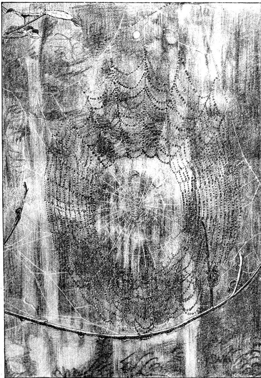
Toile d'araignée prise dans les forêts des Bayards (un jour de pluie).