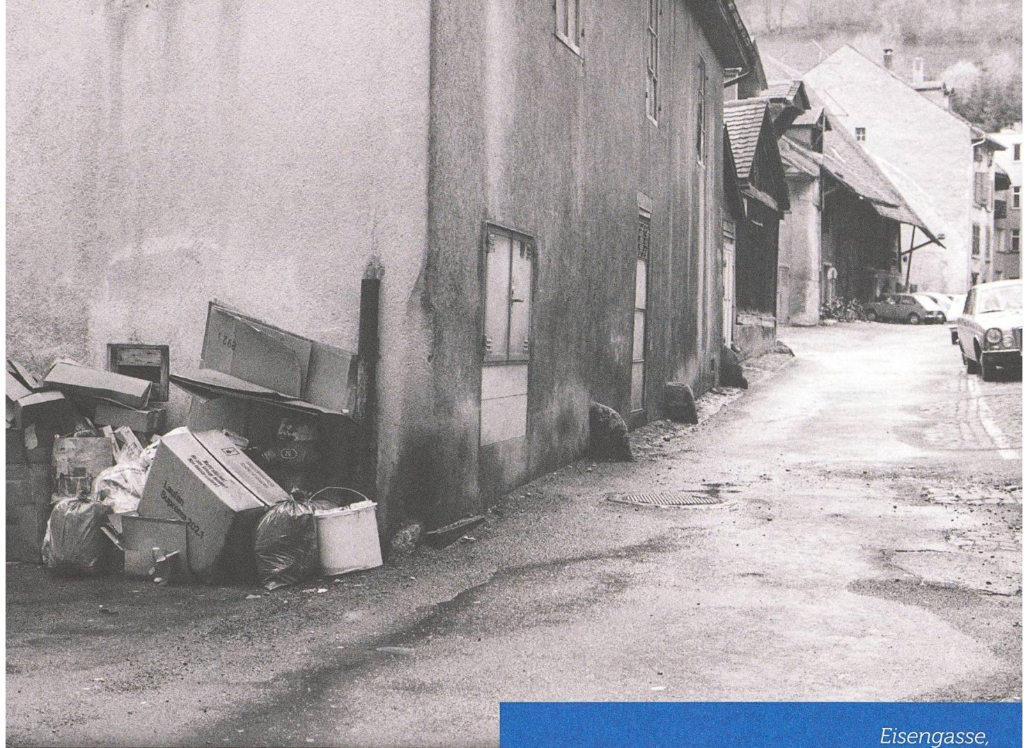
Eisengasse, Richtung Osten