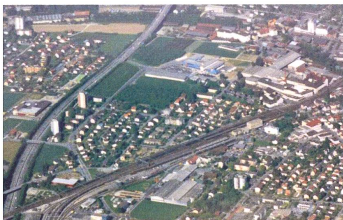
Das Wolfsackerquartier, Flugaufnahme 1950.

bestehenden Bebauung und der Autobahn wurde als Zonenerweiterung betrachtet und mittels eines Teilzonen- und eines Richtplans überbaut. Der für die 1958 gegründete Wohnbaugenossenschaft projektierte Wohnungsbau wurde im Sinne des subventionierten sozialen Wohnungsbaus entwickelt, obschon der Bodenpreis stark angestiegen war. Das Stadtbauamt schlug vor, anstatt der projektierten drei viergeschossigen Bauten und zwei zehngeschossigen Hochhäuser zwei dreigeschossige Bauten, einen viergeschossigen Bau und zwei elfgeschossige Hochhäuser zu errichten. «Nach Auffassung des Bauamts und des Stadtrates wirken die drei vorgesehenen viergeschossigen Bauten im Verhältnis zur vorherrschenden zweigeschossigen Überbauung des Breitfeldquartiers unvermittelt und hart. (...) Die betonte Vertikalität der beiden Hochhäuser erscheint tragbarer als die unruhige Silhouette von zwei-, drei- und viergeschossigen Bauten.» Und weiter: «Die Hochhäuser würden die etwas monotone Überbauung des Quartiers unterbrechen und stünden architektonisch in Wechselbeziehung zum langgestreckten Aabach-Viadukt der Autobahn.»