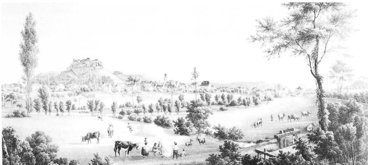
Als der Bahndamm die Stadt noch nicht entzweiteilte: Stich von Julius Rudolf Leemann (1812–1865).

ferendumsabstimmung vom 8. Juni 1980. Im Vorfeld dieser Abstimmung wurde u.a. kritisiert, dass durch diesen Strassenausbau die Anwohner zwischen der Ringstrasse Nord und der Autobahn gleich an zwei lärmigen Strassen leben müssten.