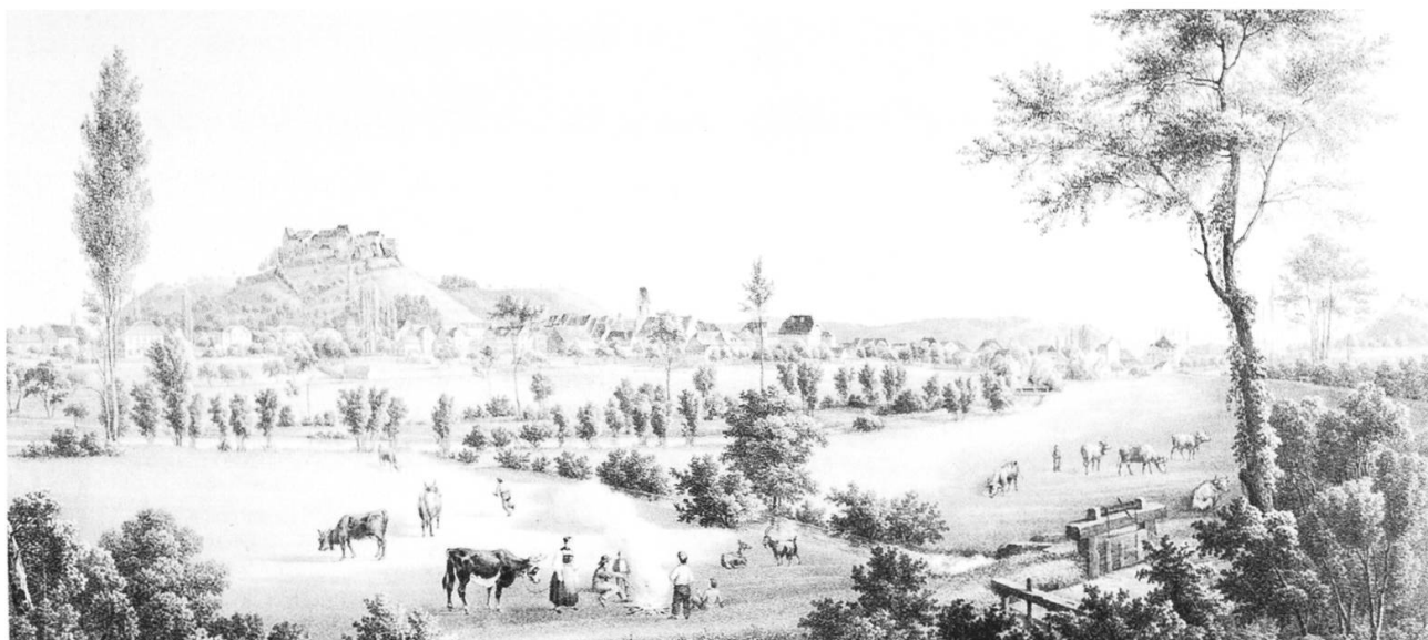
Als der Bahndamm die Stadt noch nicht entzweiteilte: Stich von Julius Rudolf Leemann (1812–1865).

ferendumsabstimmung vom 8. Juni 1980. Im Vorfeld dieser Abstimmung wurde u.a. kritisiert, dass durch diesen Strassenausbau die Anwohner zwischen der Ringstrasse Nord und der Autobahn gleich an zwei lärmigen Strassen leben müssten.