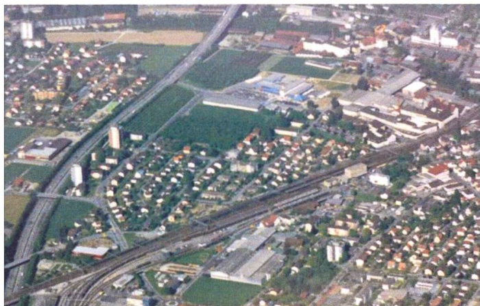
Das Wolfsackerquartier, Flugaufnahme 1950.

bestehenden Bebauung und der Autobahn wurde als Zonenerweiterung betrachtet und mittels eines Teilzonen- und eines Richtplans überbaut. Der für die 1958 gegründete Wohnbaugenossenschaft projektierte Wohnungsbau wurde im Sinne des subventionierten sozialen Wohnungsbaus entwickelt, obschon der Bodenpreis stark angestiegen war. Das Stadtbauamt schlug vor, anstatt der projektierten drei viergeschossigen Bauten und zwei zehngeschossigen Hochhäuser zwei dreigeschossige Bauten, einen viergeschossigen Bau und zwei elfgeschossige Hochhäuser zu errichten. «Nach Auffassung des Bauamts und des Stadtrates wirken die drei vorgesehenen viergeschossigen Bauten im Verhältnis zur vorherrschenden zweigeschossigen Überbauung des Breitfeldquartiers unvermittelt und hart. (...) Die betonte Vertikalität der beiden Hochhäuser erscheint tragbarer als die unruhige Silhouette von zwei-, drei- und viergeschossigen Bauten.» Und weiter: «Die Hochhäuser würden die etwas monotone Überbauung des Quartiers unterbrechen und stünden architektonisch in Wechselbeziehung zum langgestreckten Aabach-Viadukt der Autobahn.»