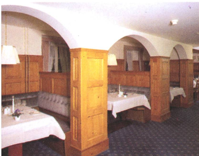
Das Restaurant Charly bietet mit seinen diskreten Nischen eine einmalige Atmosphäre.

Im Therapie-Betrieb gab es besondere Probleme. Wir hatten einen Rheuma-Spezialisten zugezogen, der wöchentlich ein- bis zweimal bei uns Sprechstunde hatte, dazu einen Masseur, eine Therapeutin und einen Bademeister. Für uns fachlich absolutes Neugebiet. Die hiesigen Ärzte waren verärgert ob der Konkurrenz aus Zürich, im Haus gab es plötzlich Kranke und Leidende, zusammen mit Gesunden, vor allem Geschäftsleuten. Der Masseur trieb komische Nebengeschäfte, der Bademeister, so hat es sich nach einem Jahr herausgestellt, konnte nicht einmal schwimmen. Langsam aber sicher musste aufgeräumt werden. Wir suchten nach einem Konzept, für alle annehmbar, und haben dieses mit der Zeit auch gefunden.