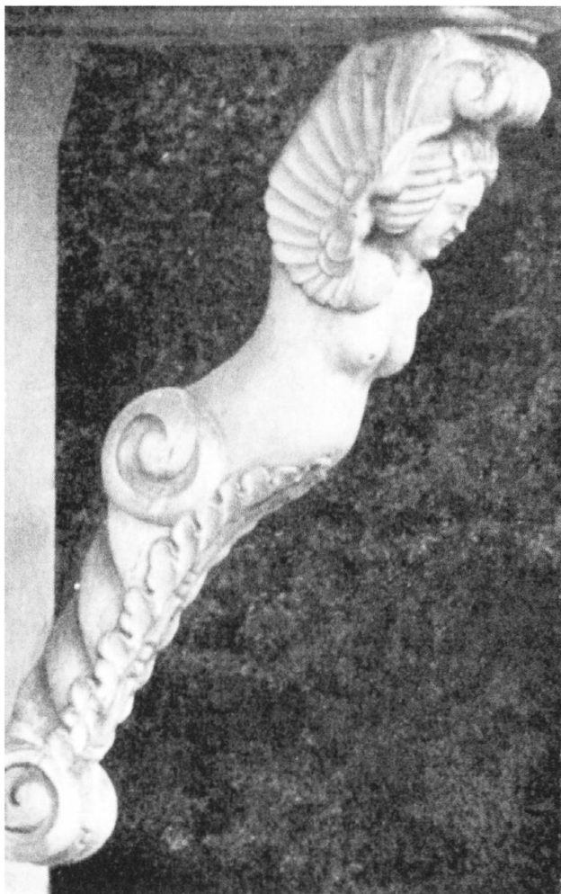
Weibliche Karyatiden tragen den mächtigen Kronen-Dachstuhl.

Das Wirtepatent des alten Ochsen an der Rathausgasse, der eines der dagegen eingetauschten Häuser war, wird trotz des Protestes von Löwenwirt Rischgasser auf die neu eingerichtete Krone übertragen. Es ist die Geburtsstunde des Gasthauses, welches im Laufe seiner langen Geschichte immer wieder die Wirte wechselte und periodisch um- und ausgebaut wurde – und bis auf den heutigen Tag und auch in der Zukunft für das Wohl der Gäste zur Verfü-