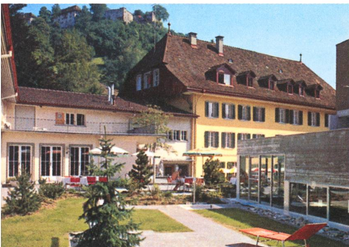
Am 1. März 1971 wurde der Neubau mit dem Hallenbad und Therapiebetrieb eröffnet.

Angeblich, so ist es aus damaligen Prospekten ersichtlich, übernahmen wir vor 29 Jahren die modernste Hotelküche der Schweiz. Seilers Restauration war bekannt, aber eben, die Gäste kamen vor allem mittags, abends war es oftmals sehr still, so dass wir uns immer allerlei einfallen lassen mussten.