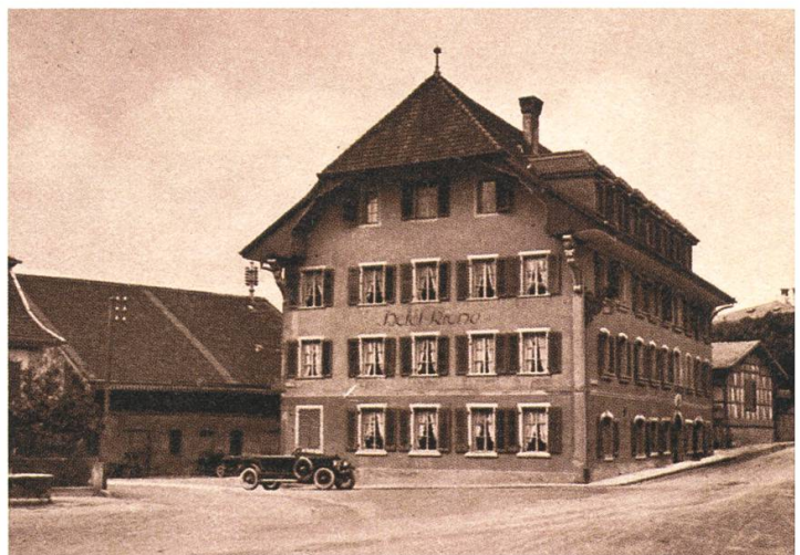
Die Krone mit den alten Stallungen 1927.