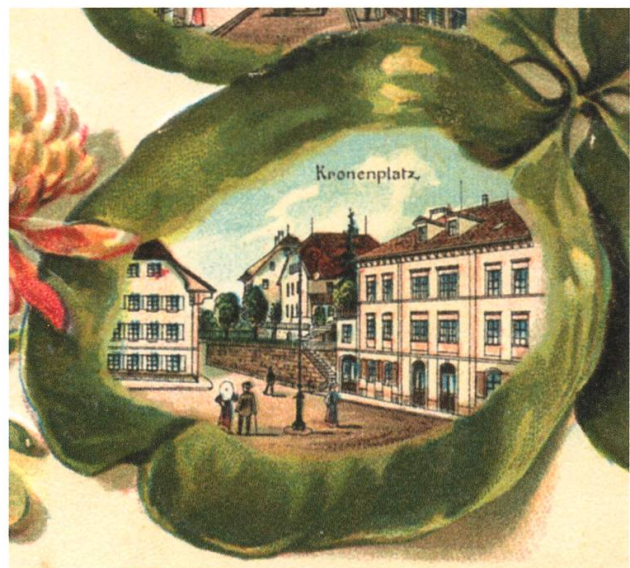
Der Kronenplatz 1909.