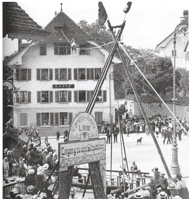
Gastspiel der Variété-Arena L. Knie auf dem Kronenplatz um 1908.

Anzahlung leisten. Ferner wird darauf hingewiesen, dass die oberen Stockwerke zwingend auszubauen sind. Somit kam das Objekt für den Käufer auf 160 000 Franken zu stehen. Die Initianten kamen zum Schluss, dass Borsinger 50 000 Franken als Bürgschaft zur Verfügung gestellt werden sollten, um ihm den Kauf zu ermöglichen. Ein Dutzend Kronen-Freunde fand sich 1923 dazu bereit, die Krone war gerettet.