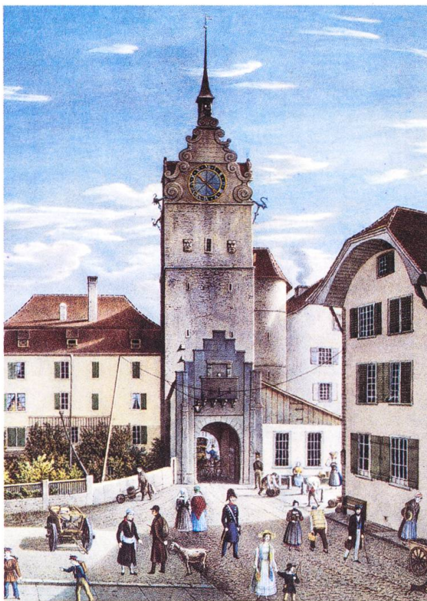
Unteres Tor 1841, Ausschnitt aus einer Lithografie von Heinrich Triner (1796–1873).

serhalb der Ringmauern gebaut werden. Diese stürzten partiell ein, der Graben wurde für Gärten genutzt, die Weiher für Fischzucht.