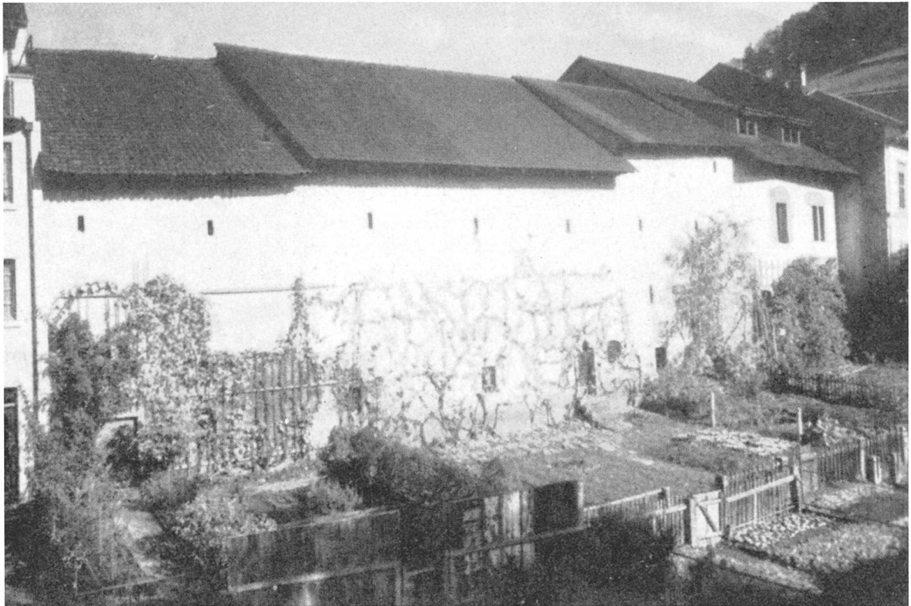
Die Ringmauer und der Graben wie sie sich anno 1903 präsentierten.