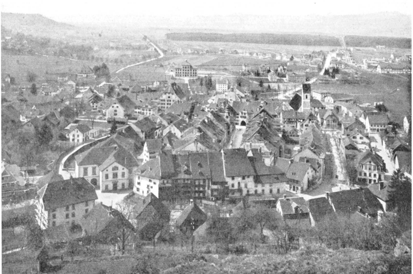
Lenzburg 1911, vom Schlossberg aus gesehen; man erkennt deutlich die hufeisenförmige Anlage.