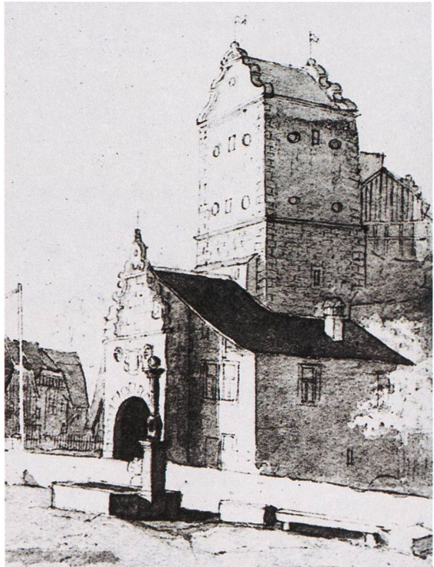
Oberes Tor, Zeichnung anonym (um 1810).

«Ob die Stadt im neuen Wehrkleide des 17. Jahrhunderts einem ernsten Angriff standgehalten hätte, muss sehr bezweifelt werden», notiert Halder. Immerhin diente sie den Bernern in den Bürgerkriegen von 1656 und 1712 als wichtiger Stützpunkt. Das 18. Jahrhundert erforderte keine neu- en Wehranlagen – jetzt durfte auch aus-