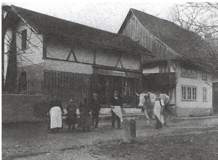
Alte Metzgerei Schumacher

Laut Zuschrift des tit. Oberamts Lenzburg vom 7. Jenner 1836 soll in dem Hause des S. F. von Staufen die Blatterpest ausgebrochen sein. Infolgedessen müsse das Haus gesperrt, eine Wache vor dasselbe gestellt, und eine Tafel an dasselbe gehängt werden. Es wurde beschlossen, eine Wache von drei Mann aufzustellen, welche dieses Haus bewachen, dass ausser denjenigen, welche die Einwohner mit Speise und Trank zu versehen haben, niemand weder ein- noch ausgelassen werde.