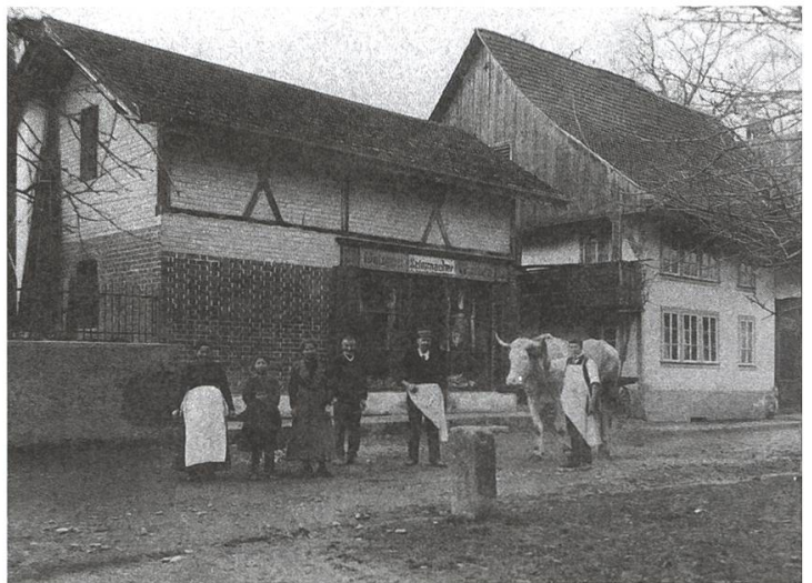
Alte Metzgerei Schumacher Archivfoto AS

Laut Zuschrift des tit. Oberamts Lenzburg vom 7. Jenner 1836 soll in dem Hause des S. F. von Staufen die Blatterpest ausgebrochen sein. Infolgedessen müsse das Haus gesperrt, eine Wache vor dasselbe gestellt, und eine Tafel an dasselbe gehängt werden. Es wurde beschlossen, eine Wache von drei Mann aufzustellen, welche dieses Haus bewachen, dass ausser denjenigen, welche die Einwohner mit Speise und Trank zu versehen haben, niemand weder ein- noch ausgelassen werde.