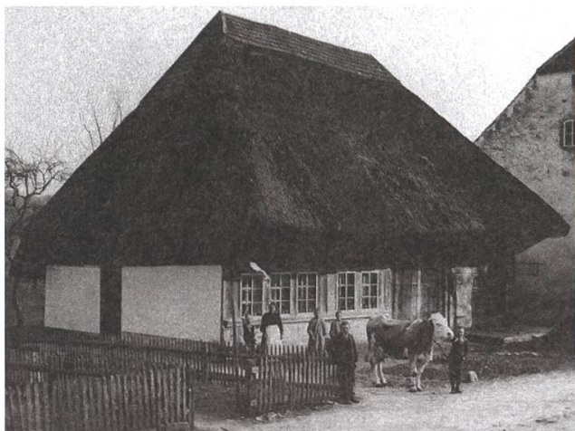
Hier steht das alte Schulhaus

hen Morgen zu Fuss zur Arbeit gehen und kamen nach einem 10-Stunden-Tag zu Fuss wieder nach Hause. Diesen Kindern blieb weder Zeit noch Kraft für die Schule.