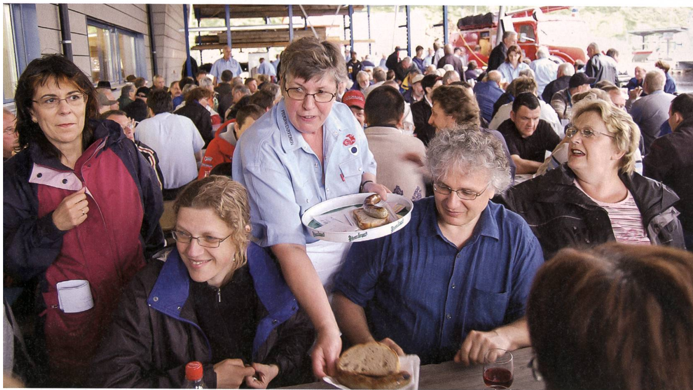
Zahlreiche Besucherinnen und Besucher waren im Sternmarsch nach Lenzburg gekommen.

Weil der Staufner Wald an den Lenzia-Forst grenzt, sind die Voraussetzungen für eine gemeinsame Beförsterung ideal. Die Fläche der Ortsbürgerwalds Lenzia hat sich damit von 1000 auf 1097 Hektaren oder um zehn Prozent, die Forstrevierfläche von 1026 auf 1141 Hektaren (elf Prozent) vergrössert. Neu sind im Staufner Forst 15 Hektaren Privatwald (insgesamt 41 Hektaren) zu betreuen. Für den Staufner Wald wird ein neuer Betriebsplan erstellt. Stadtoberförster Frank Haemmerli rechnet mit einer Jahresnutzung von 250 Silven Staufner Holz. Mit dem Zusammenschluss ist Lenzia eines der grössten Reviere im Kanton geworden.