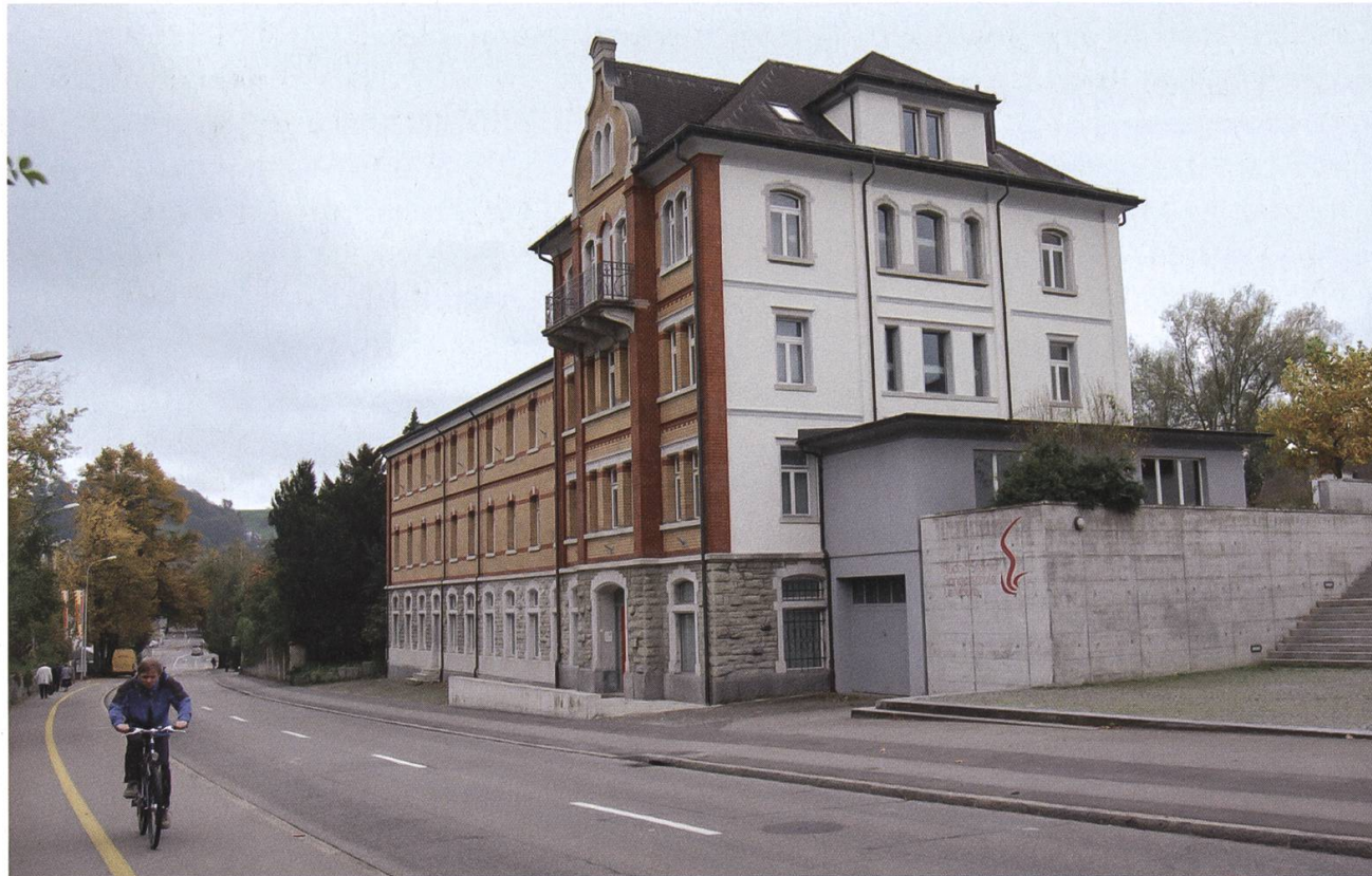
Das sanft renovierte Gebäude gehört heute der Rudolf-Steiner-Sonderschule.

Im Versandhaus wurden jeden Tag kurz vor Mittag und Abends je ein bis zwei Pakettransporte mit Pferdewagen zur Post gemacht. Der Bestellungseingang der Kunden erfolgte hauptsächlich schriftlich, telefonische Orders gab es mangels Telefonanschlüssen kaum. Die bestellten Schuhe wurden auf dem grossen Packtisch zusammengetragen und mit der Rechnung, die am Anfang noch von Hand geschrieben wurde, verpackt. Nach dem ersten Weltkrieg begann das Zeitalter der Schreibmaschine. Die Kopie wurde mittels Kohlepapier auf das darunterliegende Doppel übertragen. Der