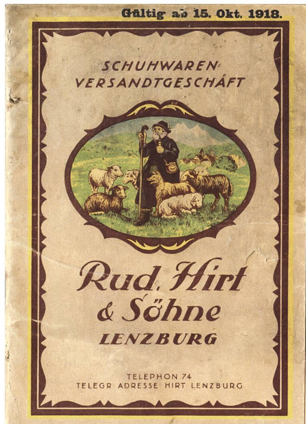
Der Schuhkatalog von 1918.