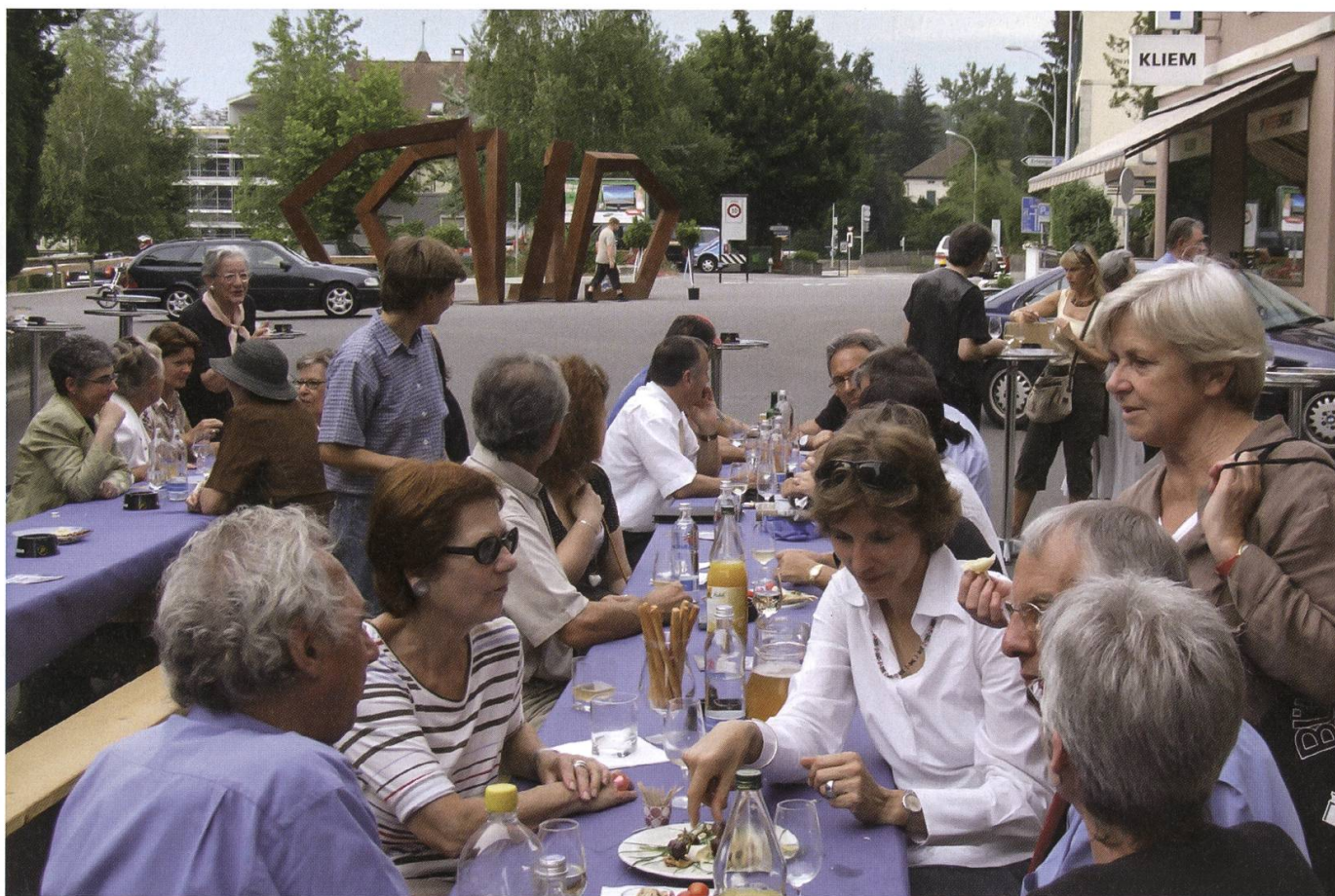
Begegnung und Bewegung auf dem neuen Lenzburger Platz, im Hintergrund die Plastik von Gillian White.

Der Volksmund ist erfinderisch, wenn es um aussergewöhnliche und deshalb gewohnheitsbedürftige Installationen und Institutionen geht. So kursierten in Lenzburg schon bald eigene Versionen und Definitionen von Platz und Skulptur: «Rosthaufen» und «Schrottplatz» sind gängige Bezeichnungen. Und am Jugendfest hing ein Spottvers über der nahen Kirchgasse: «Isch do de Gloggestuehl abgeheit? Nei, das isch d Skulptur vo der Gillian White». Und an den Stammtischen wurden Wetten abgeschlossen, wann der erste Lastwagen in den «Kreisel-Schmuck» knallt. Das Ereignis datiert vom 6. September 2007 und hat eine aufwändige Reparatur zur Folge.