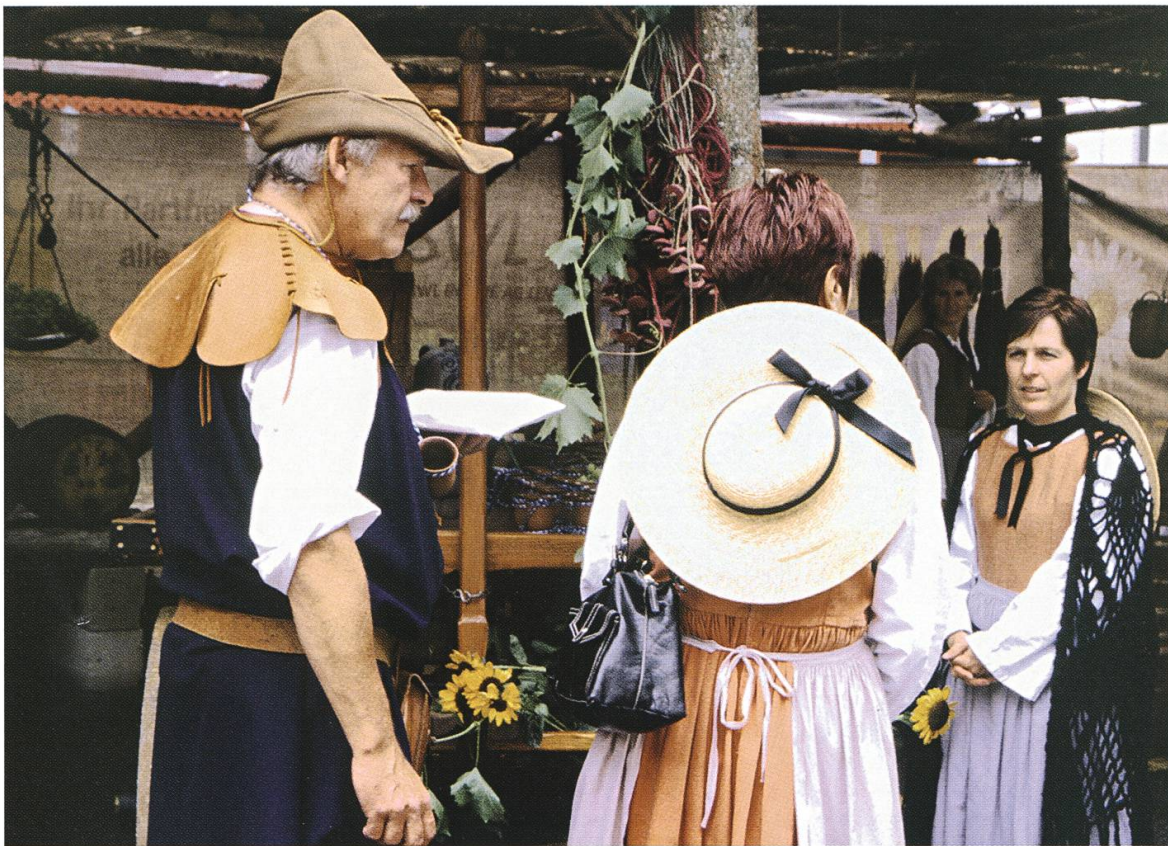
Der Jubiläumsmarkt fand ausnahmsweise bei schönem Wetter statt

Mittelalterliches Ambiente aber kam in jenen Altstadtvierteln auf, wo traditionelle Handwerkskunst wie damals auf der Strasse vor aller Augen in der Zeit angemessener Tracht und mit Werkzeug von anno dazumal demonstriert wurde. Da gab es fleissige Frauenhände beim Klöppeln, Sticken, Stricken, Spinnen, Zwirnen, Hächeln, Haarflechten, Waschen, Weben, Strohflechten, Filieren, Filzen, Eierritzen, Töpfern, Melken, Zigarrendrehen und Kartenlegen zu bestaunen, und bei den Männern Dengeln, Drechseln, Schnitzen, Schmieden, Schuhmachern, Seilern, Wursten, Steine hauen, Bier brauen, Armbrust schiessen, Mosten, Käsen, Küfern, Korben – und Liebesbriefe schreiben zu bewundern. Zum kunterbunten Treiben trugen des weiteren Marktrufer, Bänkelsänger, Gaukler, Wahrsagerinnen und Tavernenwirte bei. Weil die Reise zurück zu den Anfängen endlich vom eigentlich