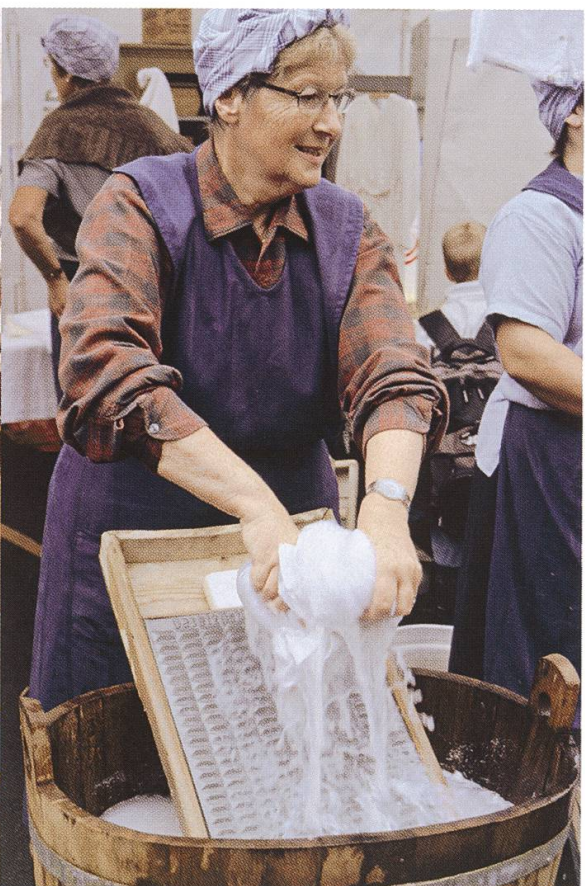
Ein Seenger «Wöschwiib»