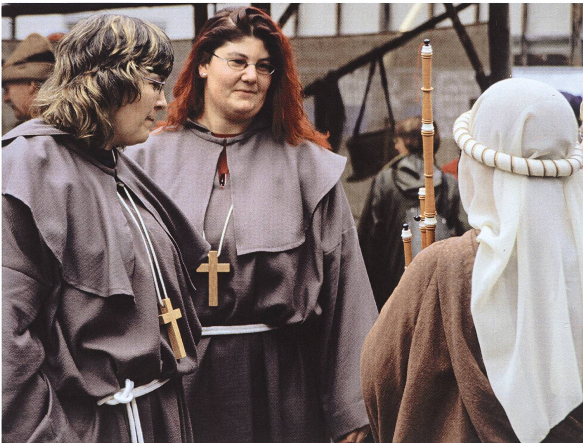
Eine Begegnung am Lenzburger Jubiläumsmarkt