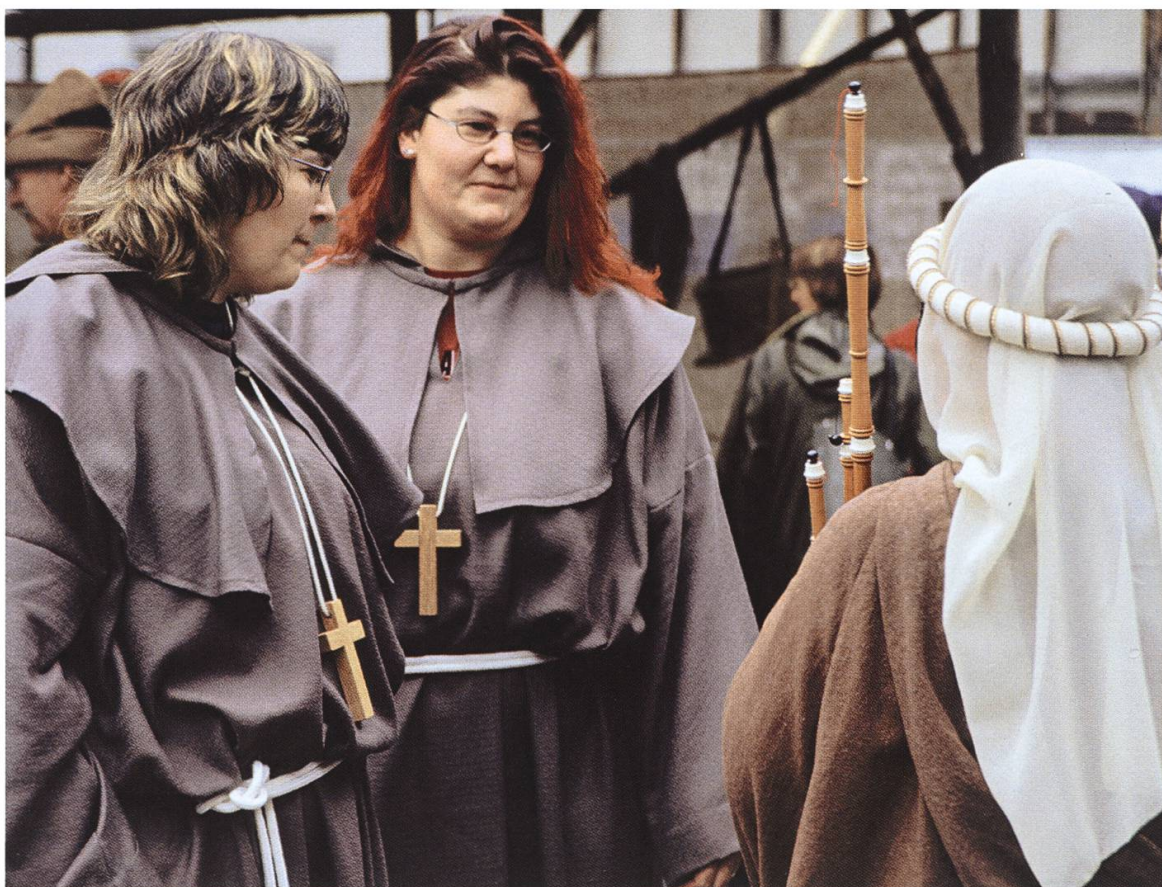
Eine Begegnung am Lenzburger Jubiläumsmarkt