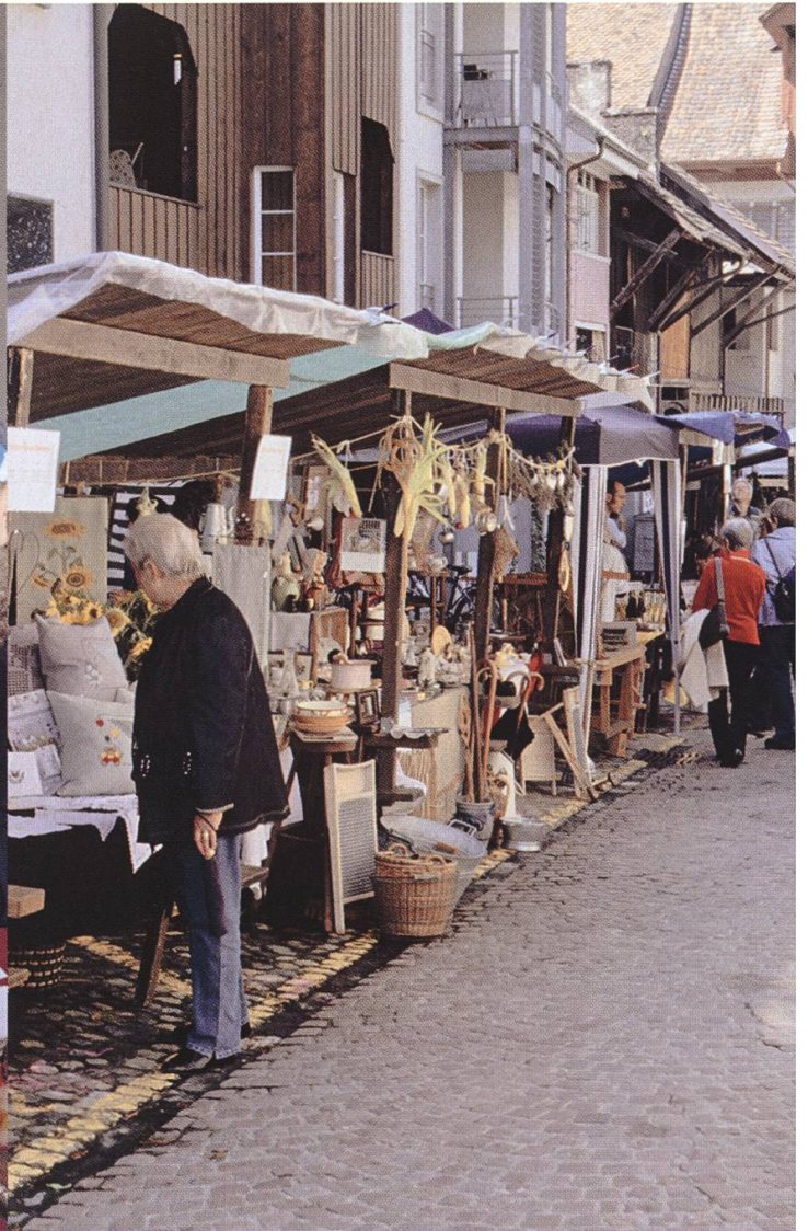
Trödelmarkt am Oberen Scheunenweg