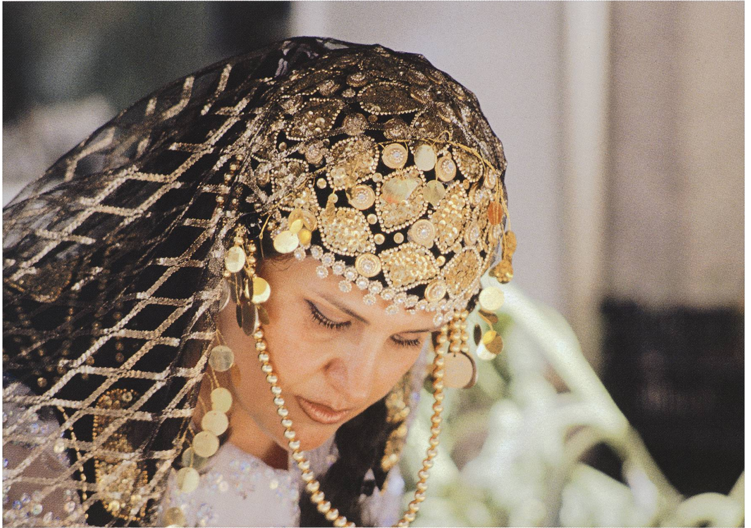
Exotik in Lenzburg: eine Marktfahrerin aus dem Iran