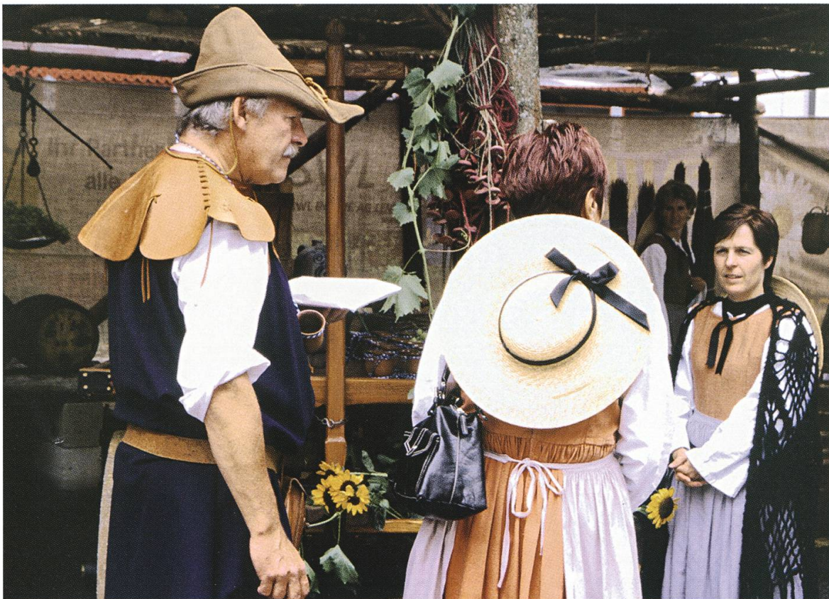
Der Jubiläumsmarkt fand ausnahmsweise bei schönem Wetter statt

Mittelalterliches Ambiente aber kam in jenen Altstadtvierteln auf, wo traditionelle Handwerkskunst wie damals auf der Strasse vor aller Augen in der Zeit angemessener Tracht und mit Werkzeug von anno dazumal demonstriert wurde. Da gab es fleissige Frauenhände beim Klöppeln, Sticken, Stricken, Spinnen, Zwirnen, Hächeln, Haarflechten, Waschen, Weben, Strohflechten, Filieren, Filzen, Eierritzen, Töpfern, Melken, Zigarrendrehen und Kartenlegen zu bestaunen, und bei den Männern Dengeln, Drechseln, Schnitzen, Schmieden, Schuhmachern, Seilern, Wursten, Steine hauen, Bier brauen, Armbrust schiessen, Mosten, Käsen, Küfern, Korben – und Liebesbriefe schreiben zu bewundern. Zum kunterbunten Treiben trugen des weiteren Marktrufer, Bänkelsänger, Gaukler, Wahrsagerinnen und Tavernenwirte bei. Weil die Reise zurück zu den Anfängen endlich vom eigentlich