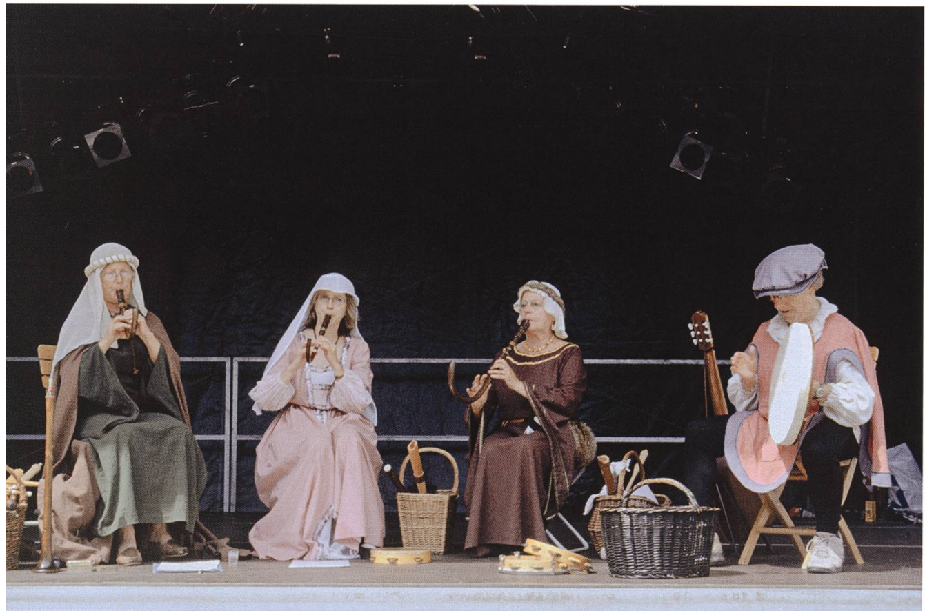
Musikantengruppe in mittelalterlichen Kostümen