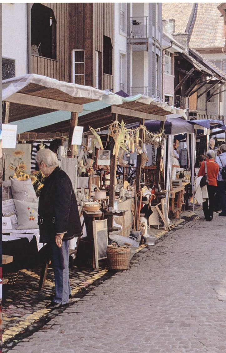
Trödelmarkt am Oberen Scheunenweg