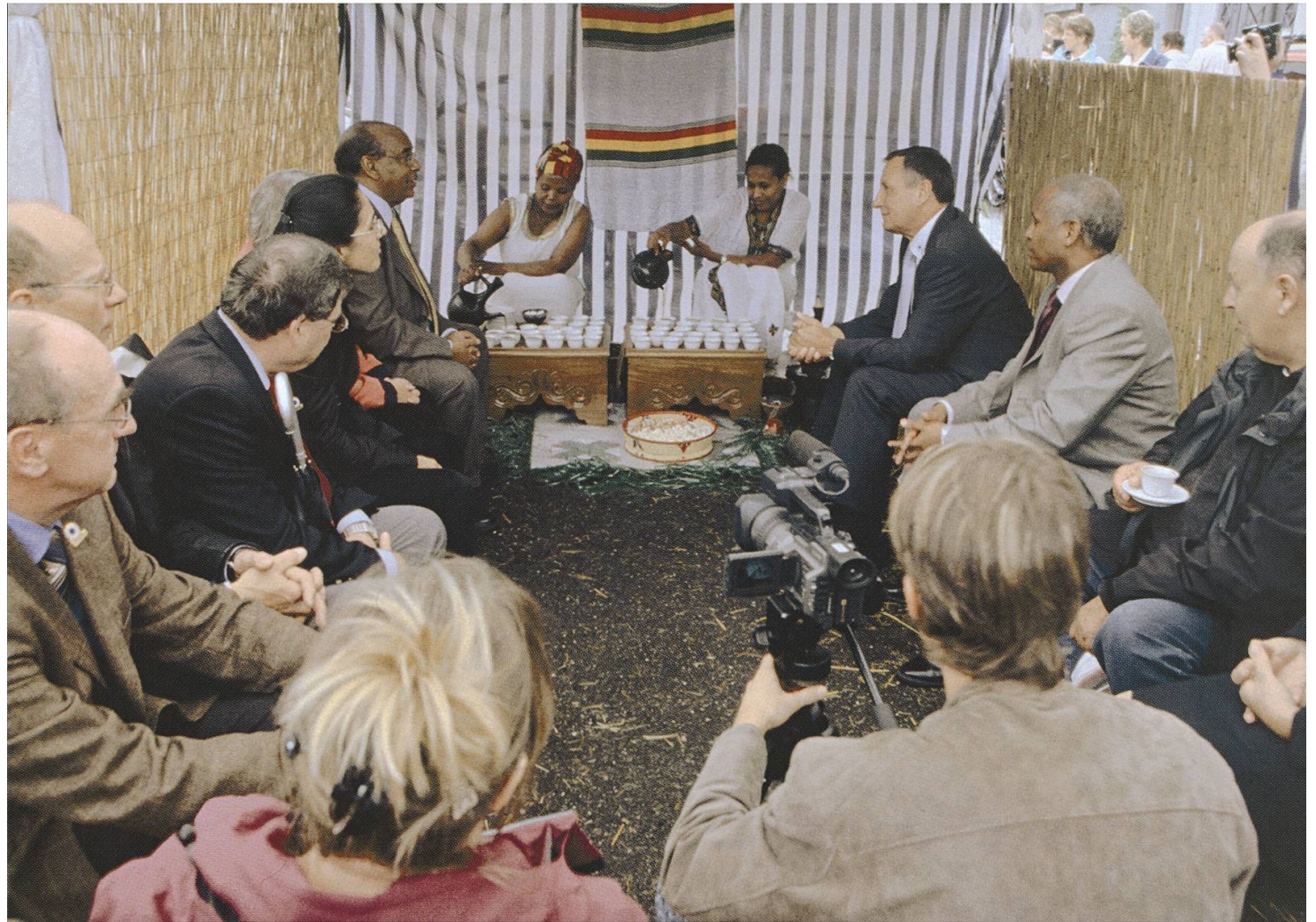
Im Fokus: Der äthiopische Botschafter und der Stadtrat im Kaffeehaus «Zum blauen Nil»