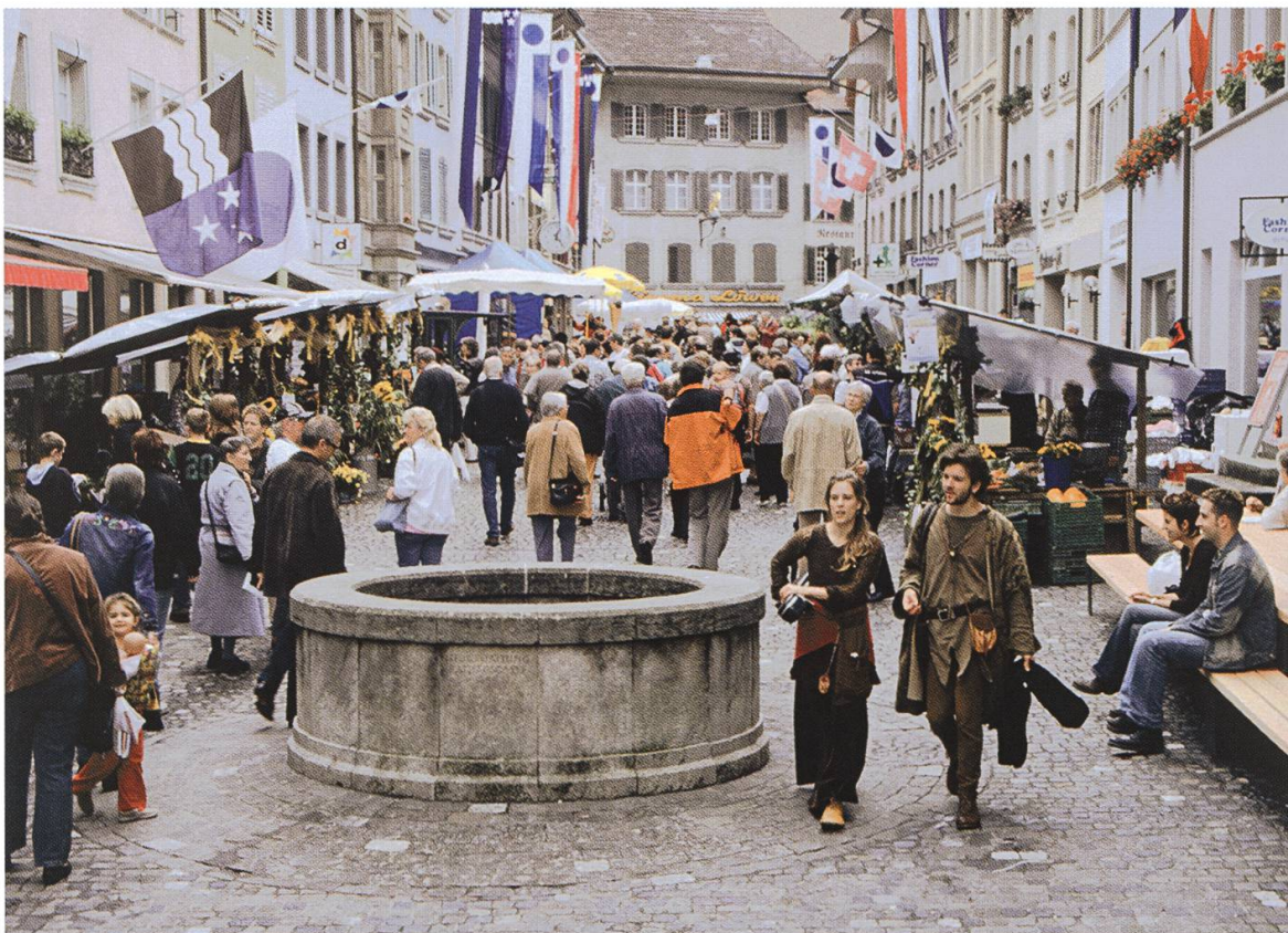
Tausende besuchten den Jubiläumsmarkt in der Altstadt

Während am Dienstag im «natürlichen Einkaufszentrum» Altstadt die Marktstände für das Grossereignis aufgestellt wurden, zog sich der traditionelle Wochenmarkt unter die Arkaden des alten Gemeindesaals zurück. Was aus dem Mittelalter bis auf den heutigen Tag noch zweimal wöchentlich lebendig geblieben ist, hat an einem kleinen Ort Platz. Am Mittwoch aber platzte der Marktplatz Lenzburg fast gar aus allen Nähten. Ein solch vielfältiges Angebot hat es in den letzten 700 Jahren in Lenzburg wohl nur selten gegeben.