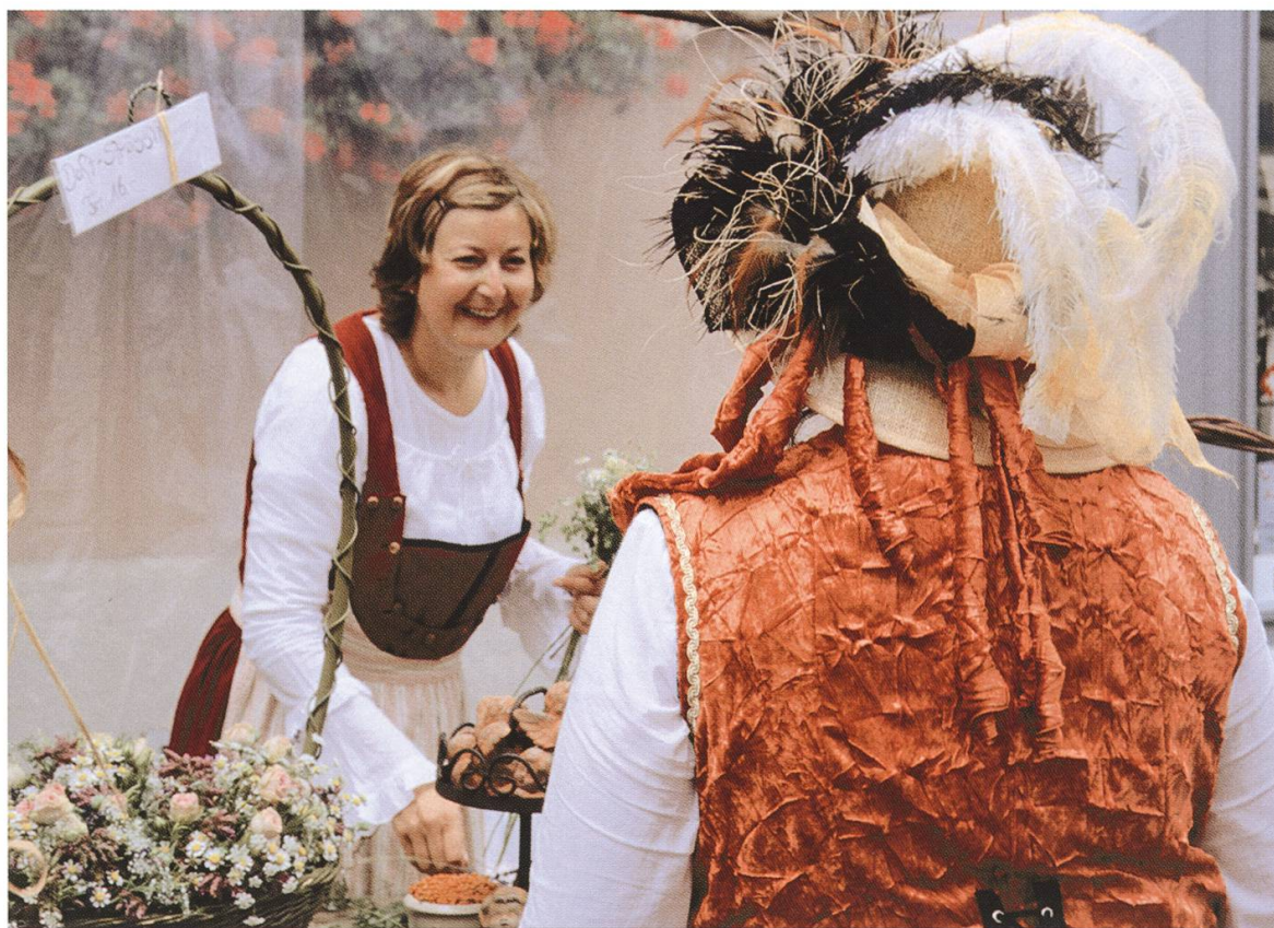
Marktszene in der Rathausgasse