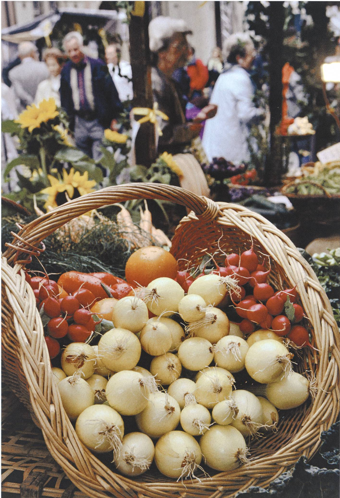
Gemüsemarkt in der Rathausgasse