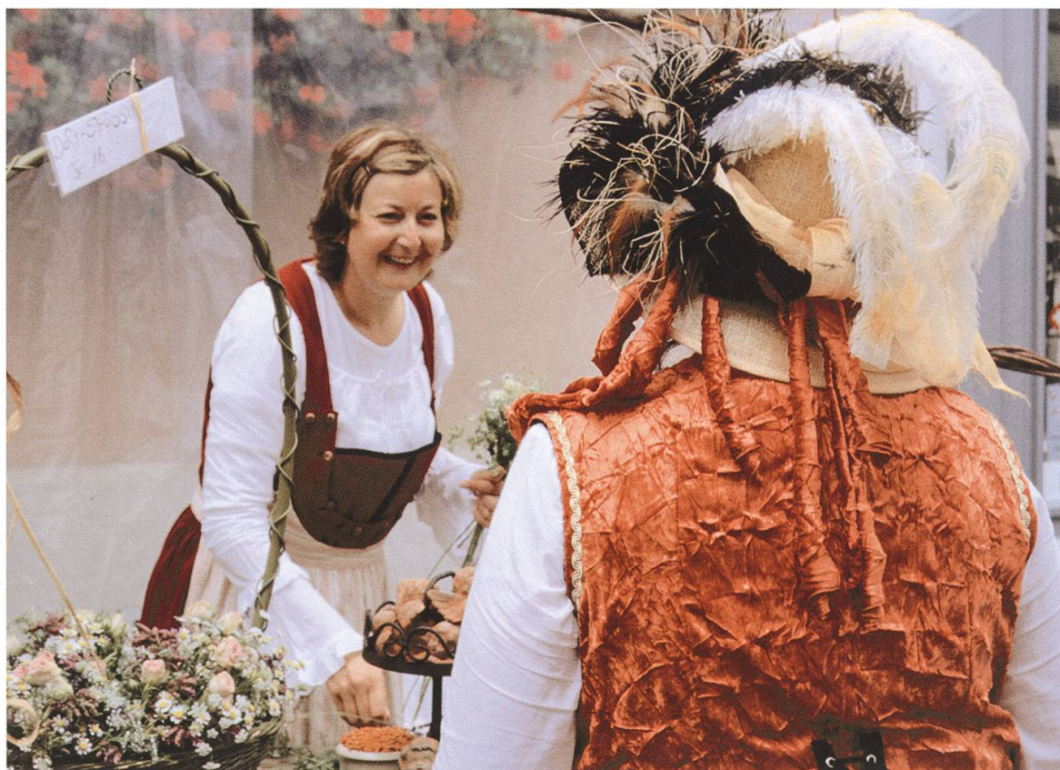
Marktszene in der Rathausgasse