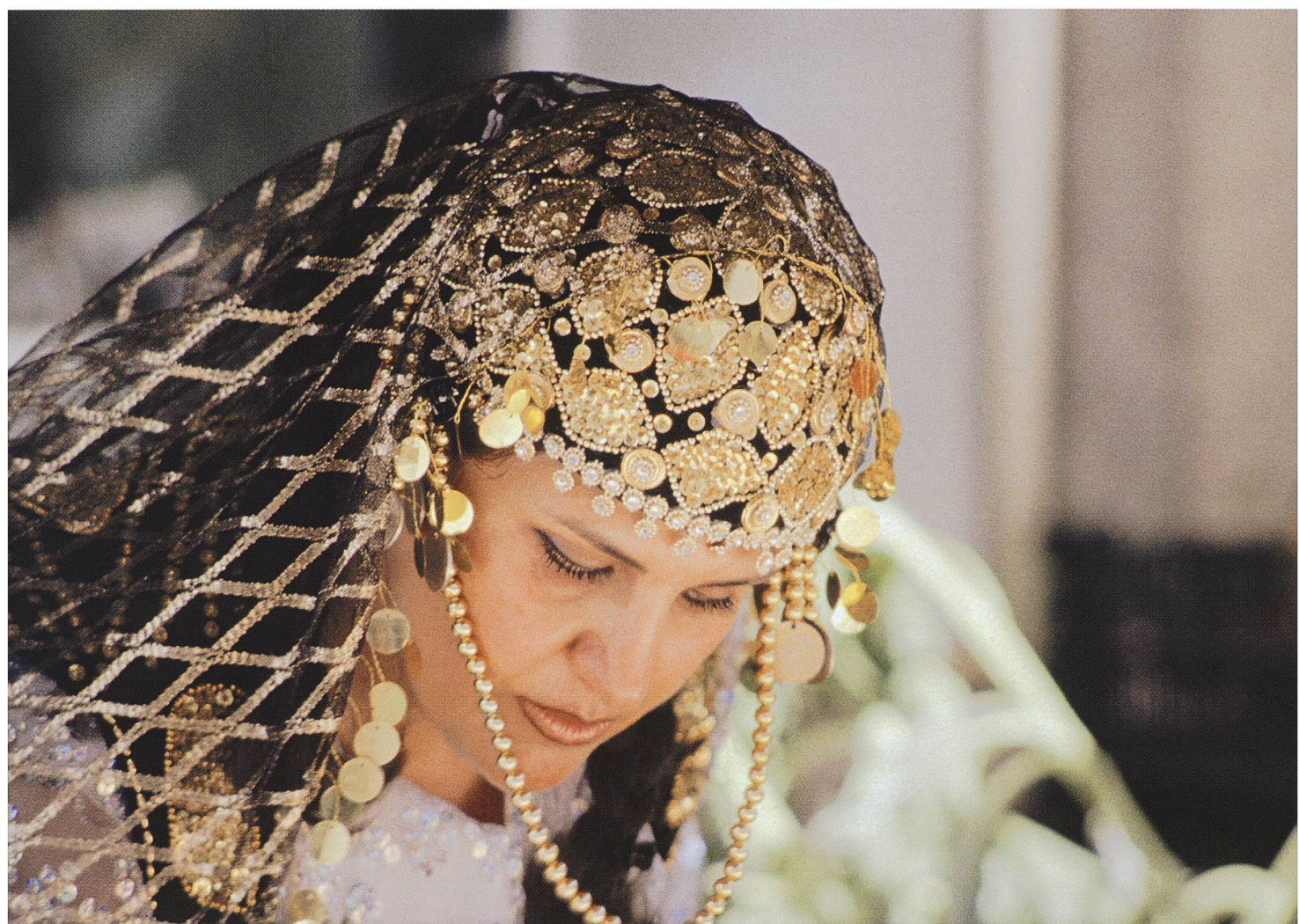
Exotik in Lenzburg: eine Marktfahrerin aus dem Iran