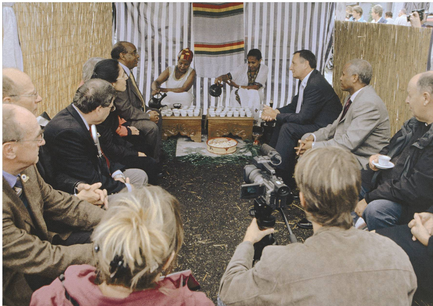
Im Fokus: Der äthiopische Botschafter und der Stadtrat im Kaffeehaus «Zum blauen Nil»