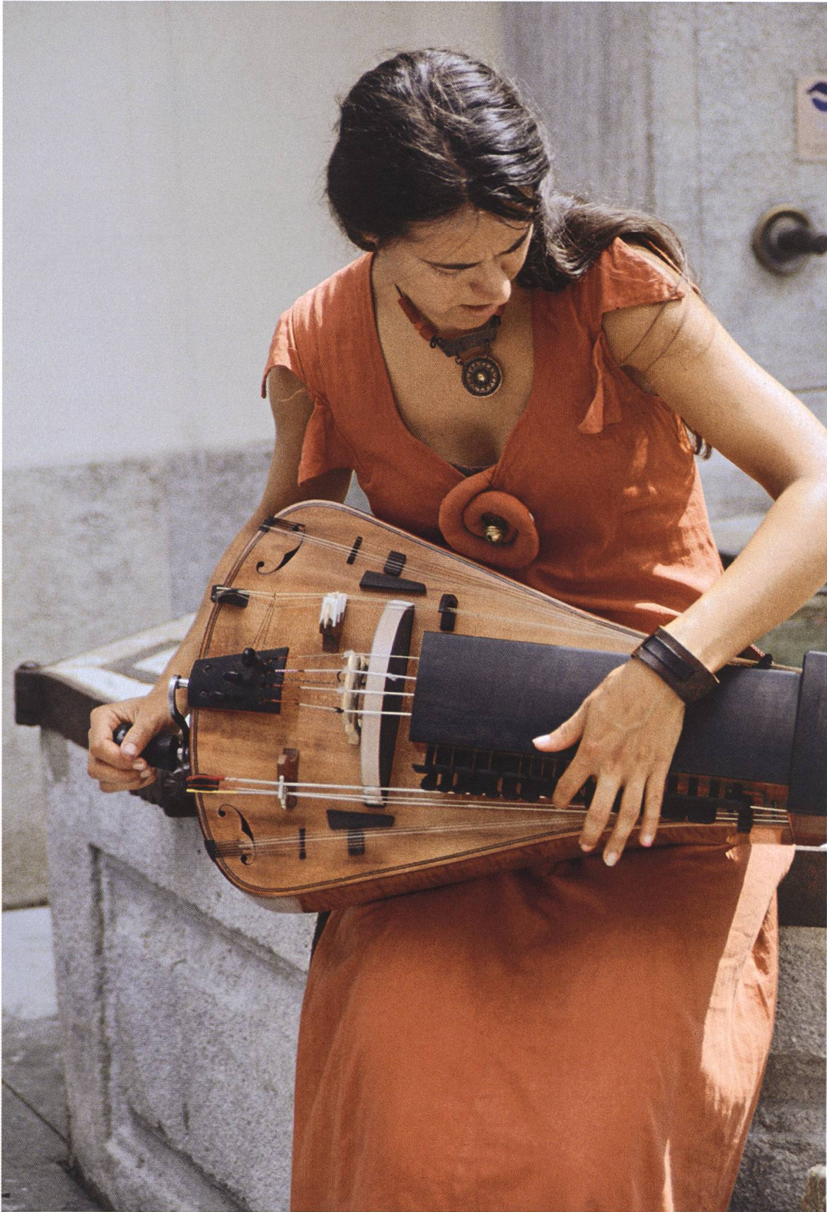
Am Jubiläumsmarkt: Musikantin mit Drehleier