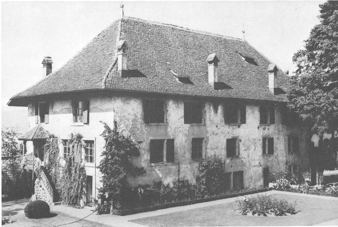
Das alte Bernerhaus vor dem Umbau, wie es noch 1962 aussah.

Staatsbewußtsein fördert, sondern auch die eidgenössische Sendung des Aargaus aktiviert». «Der Aargau als Kanton der Mitte bedarf... eines geistigen und kulturellen Gravitationszentrums, das seit Jahrzehnten offensichtlich nicht mehr vorhanden war», schrieb der Stiftungsrat 1958 hochgemut.