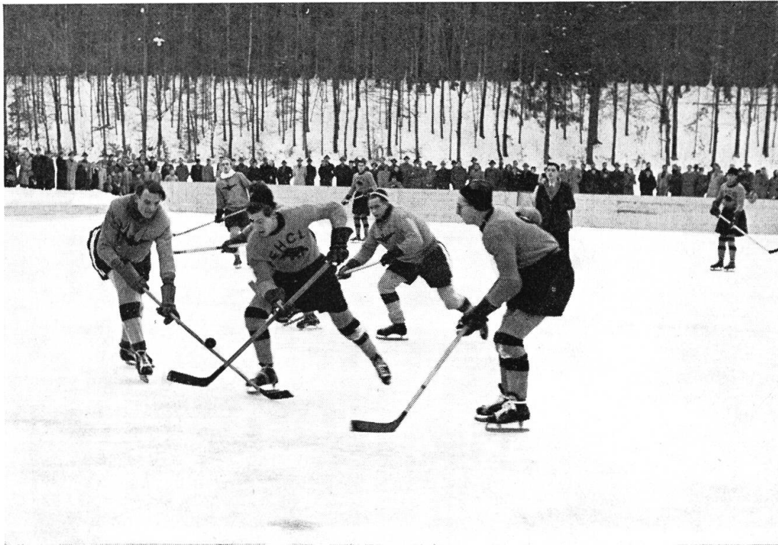
Einer der wenigen Angriffe der Lenzburger im ersten Spiel gegen Aarau (29. Januar 1950)