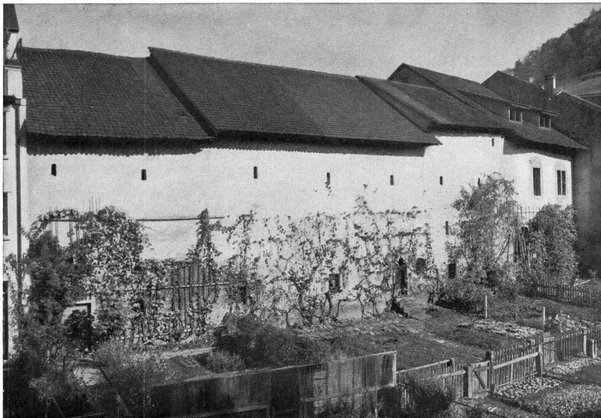
«Zum Grabengärtchen führte eine kleine Spitzbogentüre»

Aus „Die Kunstdenkmäler der Schweiz“, Kanton Aargau II Herausgegeben von der Gesellschaft für Schweizerische Kunstgeschichte Birkhäuser-Verlag Basel