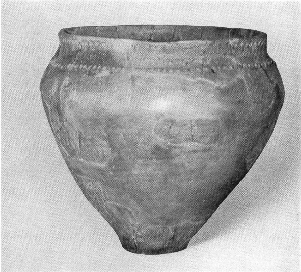
Vorratsgefäß aus der mittleren Bronzezeit (Höhe 55,5 cm; Umfang der Bauchung 183 cm) Siedlungsfund in Niederlenz von Alfred Huber (siehe Neujahrsblätter 1960)