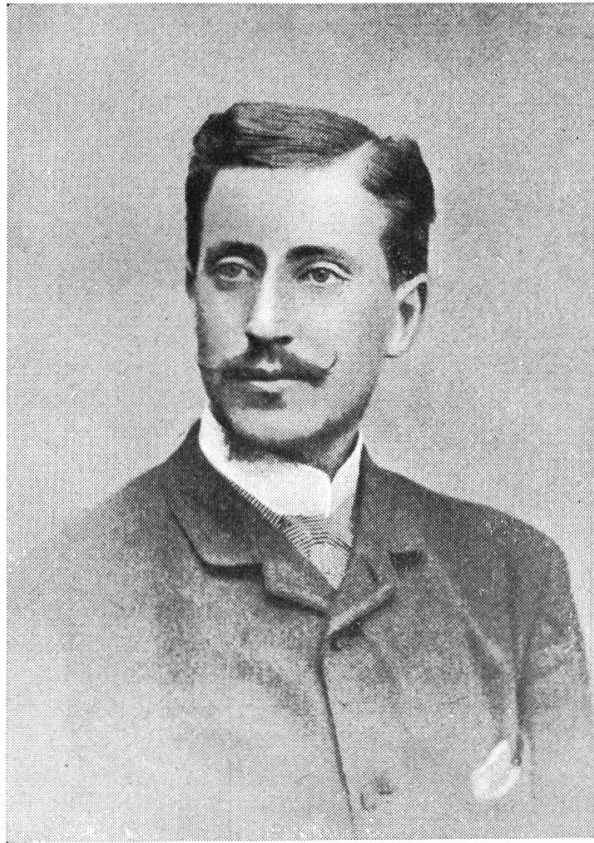
Werner von Heidenstam 1885