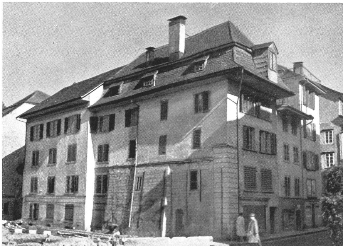
Das 1953 abgebrochene „Waltyhaus“