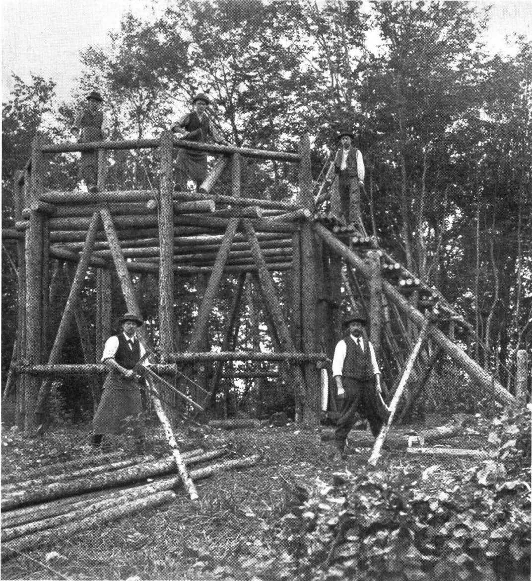
Das 1906 eingeweihte Podium