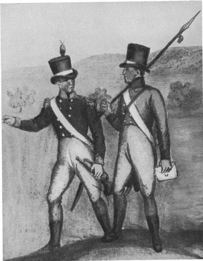
Aargauischer Postläufer (rechts)