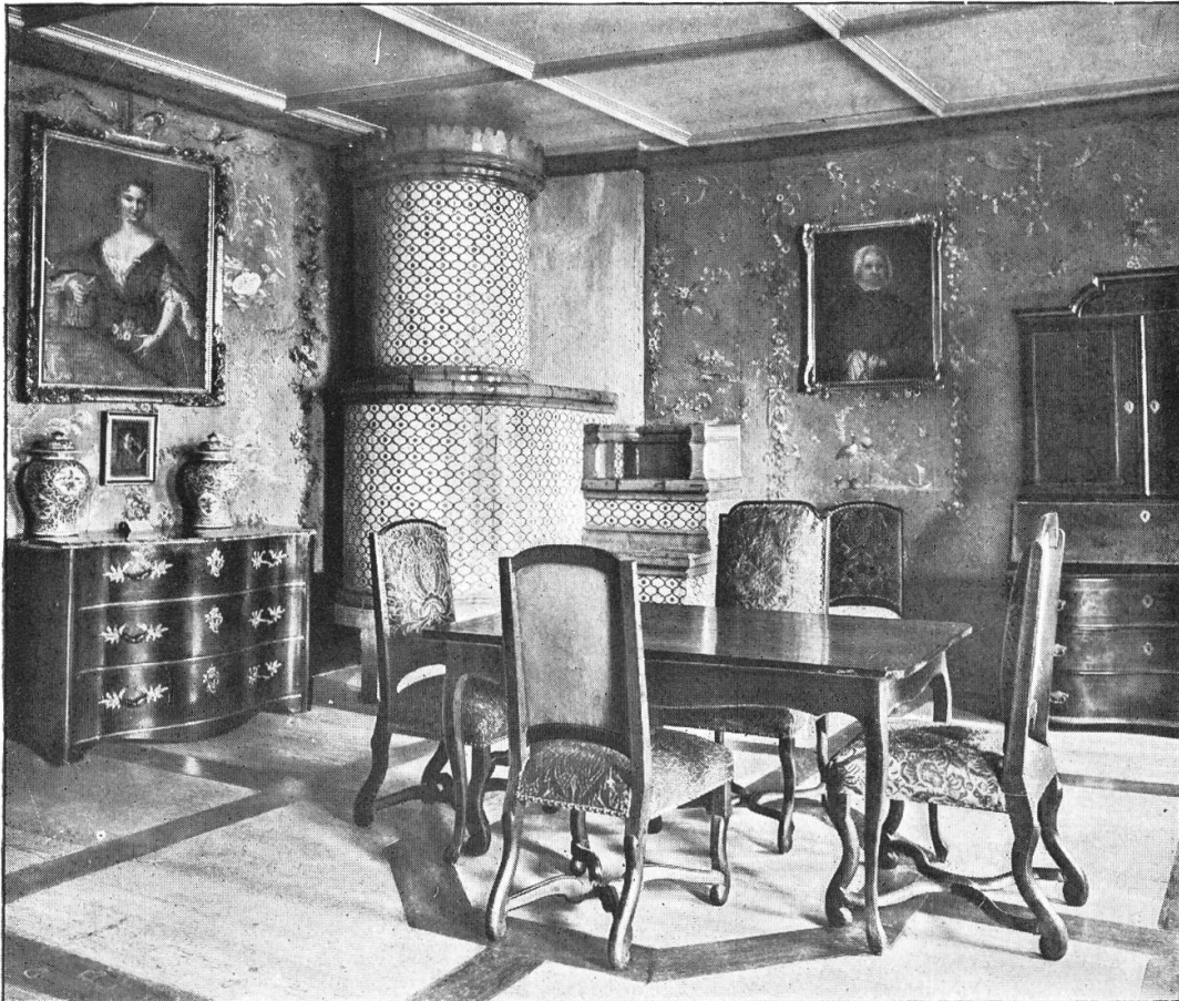
Die «gelbe» oder «Salis-Stube», das Sterbezimmer der Marie-Louise im Schloß Wildegg