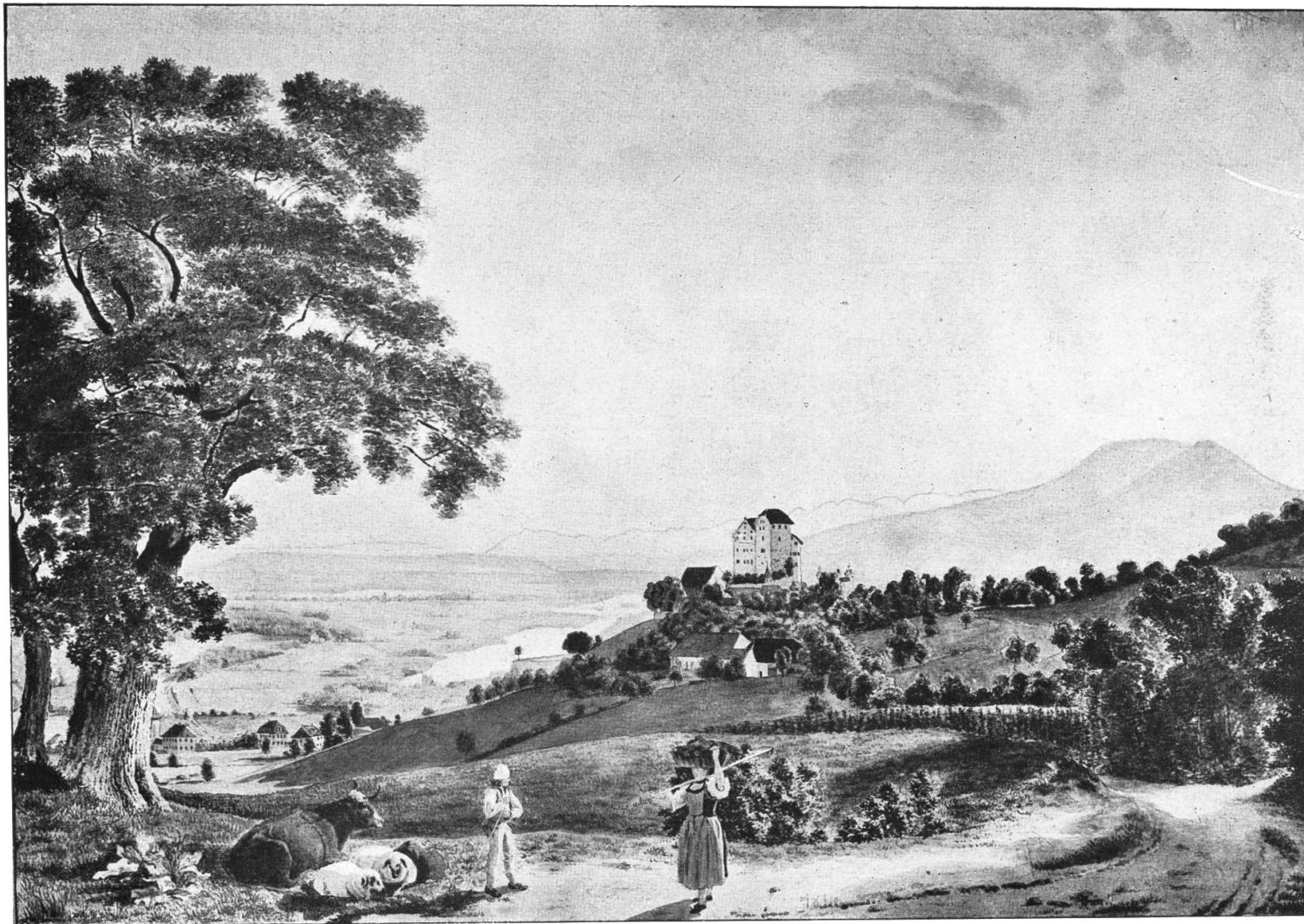
Schloß Wildegg von Süden. Nach einem Aquarell von Em. Rud. von Effinger aus dem Anfange des 19. Jahrhunderts