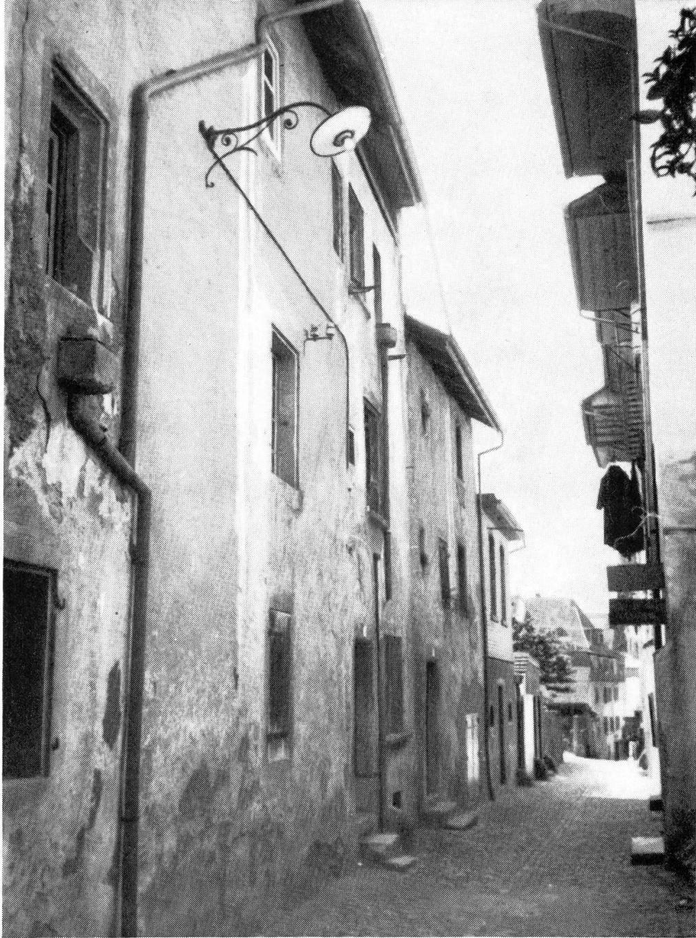
Das malerische Rathausgäßchen kurz vor dem Abbruch