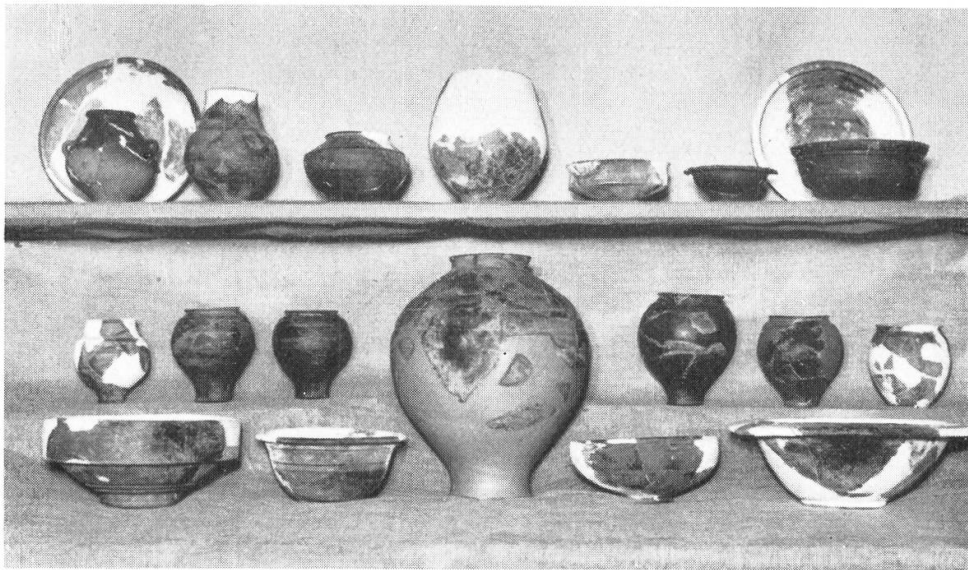
Römische Gefäße im Heimatmuseum aus Sigillata und Nigra-Erde; in der mittleren Reihe rätische Urnen. Die Gefäße sind ergänzt.