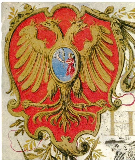
Abb. 4: Obere linke Ecke der Urkunde: Das Wappen von Hieronymus Angelus. – Burgerbibliothek Bern, Mss.h.h.LII.3 (3).

7 Vgl. Thomas Schmid, Ritterschaft und Ehebruch , in: Medaillon . Informationen aus der Burgergemeinde Bern, Nr. 13, 2010, S. 8f.