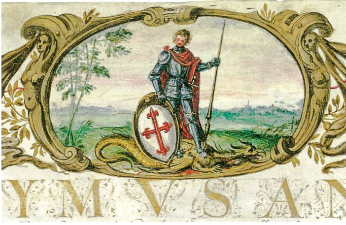
Abb. 1: Kartusche in der Mitte des oberen Rands der Urkunde: Der Heilige Georg triumphiert über den Drachen. – Burgerbibliothek Bern, Mss.h.h.LII.3 (3).

Neben einer Fülle weiterer Privilegien enthält das Diplom auch noch eine Besserung von Bendichts Wappen: Fortan darf er den doppelköpfigen kaiserlichen Adler führen, auf dessen Brust das bisherige Nägeli-Wappen mit den zwei gekreuzten Nägeln erscheint (Abb. 2). Die Begründung des Fürsten für seinen Gnadenakt bleibt vage: Nägelis erwiesener aufrichtiger und stand-