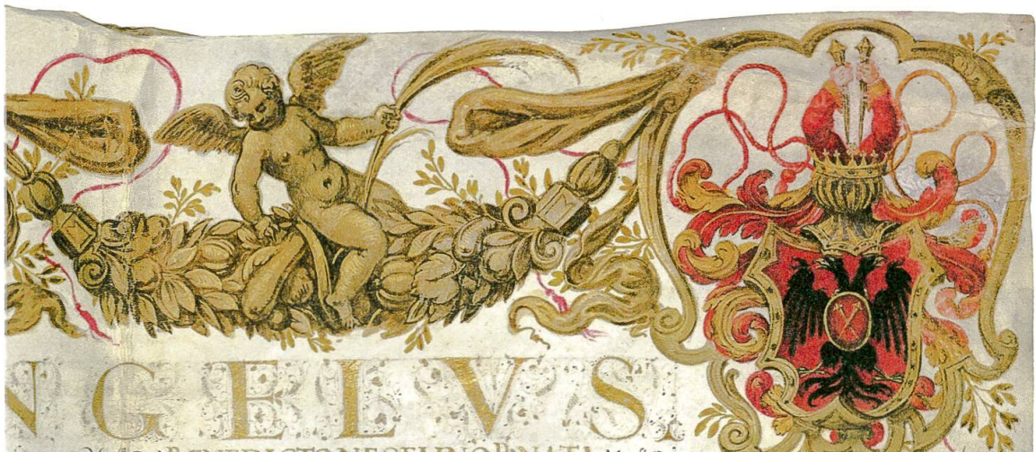
Abb. 2: Obere rechte Ecke der Urkunde, anschließend an die Kartusche in der Mitte (Abb. 1): Ein Putto schaukelt auf einer floralen Girlande (analoges Dekor links der Kartusche); das gebesserte Wappen von Bendicht Nägeli. – Burgerbibliothek Bern, Mss.h.h.LII.3 (3).

Zwar sind uns Nägelis Absichten in der – bestimmt kostspieligen – Sache nicht überliefert, sie lassen sich aber erschließen, war doch der Erwerb von Adel und Titeln ein probates Mittel zur Sicherung einer einmal erlangten gesellschaftlichen Machtstellung und zur Förderung weiteren Aufstiegs. Zwar hatte Bendicht zu Hause in Bern keine Aussicht, seinen neuen Grafentitel geltend zu machen, dafür setzte er sein gebessertes Wappen gebührend in Szene. Von 1572 ist eine entsprechende Wappenscheibe erhalten, 5 und 1576 ließ er sich mit der Goldkette eines Ritters porträtieren – und auch auf diesem Gemälde durfte das Wappen mit dem Doppeladler nicht fehlen. 6 Dass ihm all diese Investitionen am Ende nichts nützen sollten, lag an Nägeli selbst. Sein zerrüttetes Eheleben und die Missachtung eines obrigkeitlichen Solddienstverbots kosteten ihn in Bern jede Chance auf eine poli-