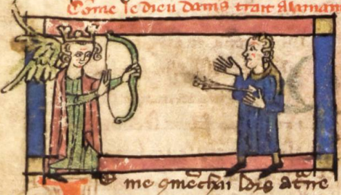
me gmechar lors d'ene