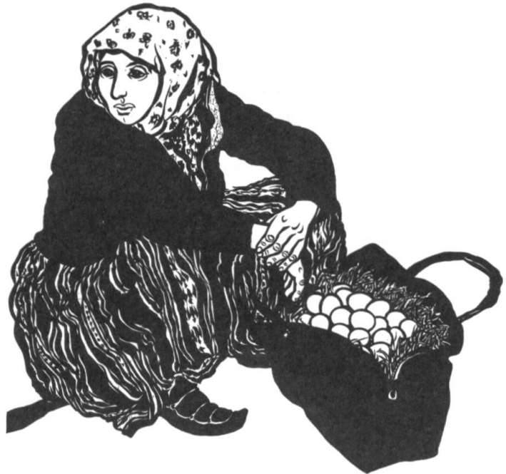
Auf dem Markt von Prizren. 1993. 37×36 cm.