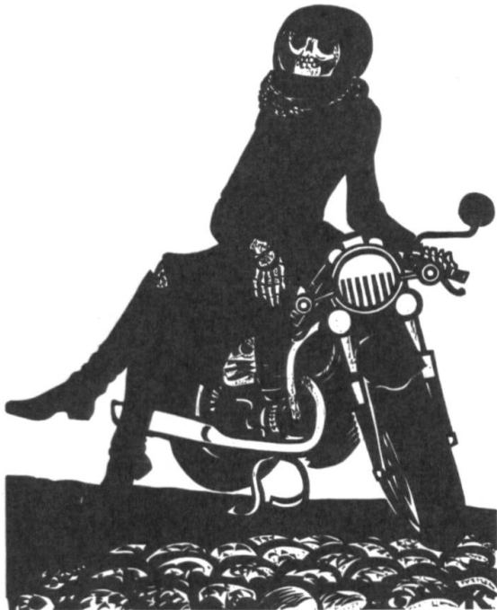
Heinz Keller: «Mich wundert, dass ich fröhlich bin.» [7]

1981, 1993 und 2008 erscheinen drei Werkverzeichnisse [5, 12, 19], die umfassend Leben und Werk des Künstlers dokumentieren.