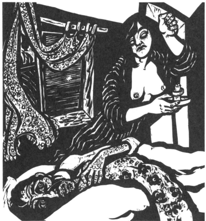
«Hiob wird von seiner Frau verlassen.» [10]

Als weitere Auseinandersetzung mit dem Krieg in Jugoslawien entsteht 1996 ein Leporello mit 5 Holzschnitten: «In Bosnien hat der Tod getanzt» im kleineren Format 10 × 16 cm und einer kurzen Chronologie der Ereignisse in Bosnien [14].