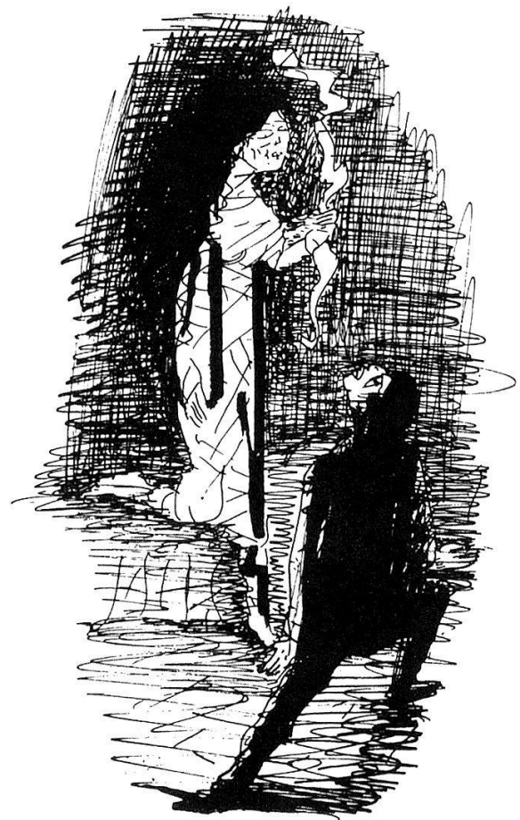
Illustration zu «Erzählungen» von Edgar Allen Poe. Federzeichnung 1961/62.

Hegenbarths gewohnt hatten, wieder mit den originalen Möbeln und Einrichtungsgegenständen ausgestattet, womit es sich heute noch in dem Zustand präsentiert, den Hanna Hegenbarth hinterlassen hat. 1957 hatte Menzhausen die Wohnung besucht und deutlich im Gedächtnis behalten: «Ich erinnere mich an eine Folge kleiner Räume mit weißen Wänden, auf denen einzelne Arbeiten des Meisters hingen – zur Kontrolle, sagte er. Frühchinesische Bronzen sah ich auf Kommoden oder Schreibpulten aus dem späten 18. Jahrhundert oder aus dem frühen Biedermeier, allesamt sächsisch, sehr einfach, auf reine Flächenwirkungen hin gebaut. Dieses ruhige Erscheinungsbild wurde belebt durch einen prachtvollen Bauernschrank mit vielfarbigen Bildfeldern in Rocailles, den er aus seiner böhmischen Heimat mitgebracht hatte, und