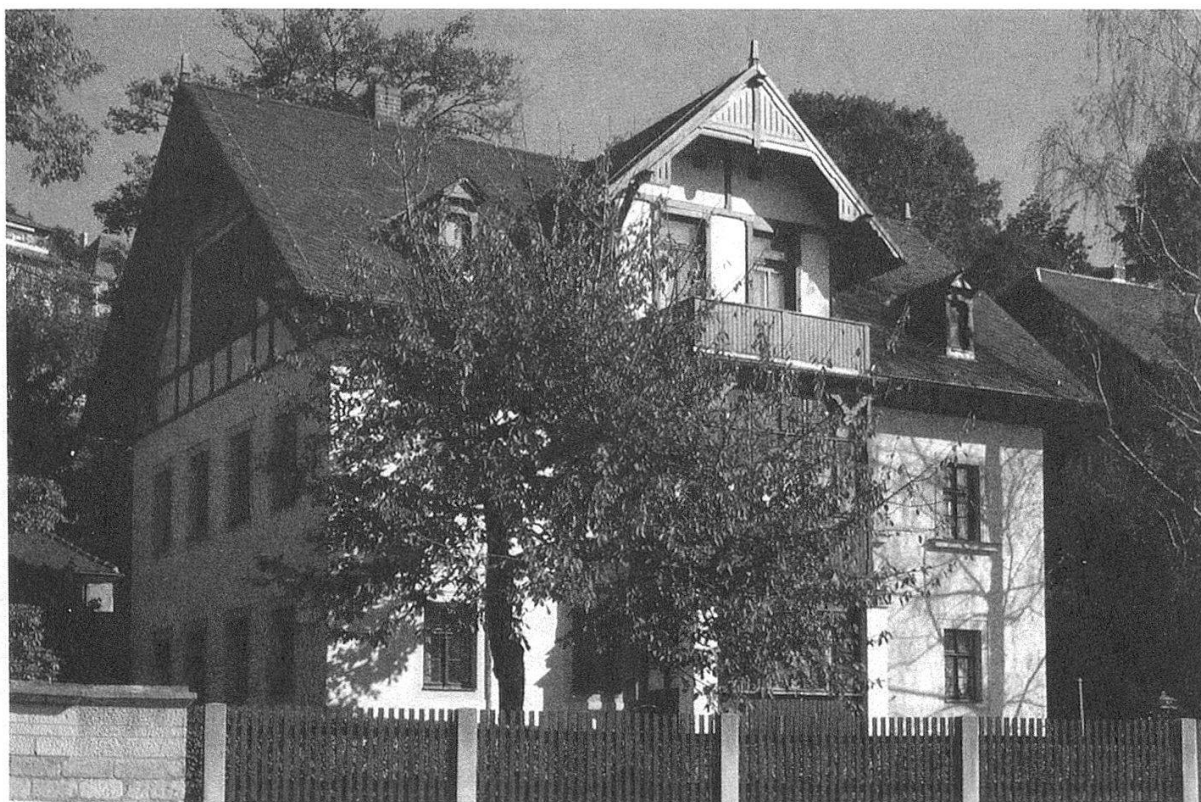
Haus von Josef Hegenbarth in Dresden.

sacht durch eine Karikatur in der «Jugend», und deshalb ausweichend viele Tierdarstellungen zeichnete, wurde er 1946 zum Professor an die Dresdner Akademie berufen und ihm die Leitung der Illustrationsklasse übertragen. Diese Tätigkeit gab er 1949, mit Erreichen der Altersgrenze, wieder auf. Sein Lebenswerk erfuhr in beiden deutschen Staaten gleichermaßen Anerkennung: 1954 erhielt er den Nationalpreis der DDR und war noch 1960 Mitglied der Bayerischen Akademie der Schönen Künste in München geworden, nachdem er bereits 1955 bzw. 1956 zum Mitglied der Akademien in Berlin-Ost und -West gewählt worden war. 1962 starb er in Dresden und wurde auf dem Friedhof in Loschwitz beigesetzt.