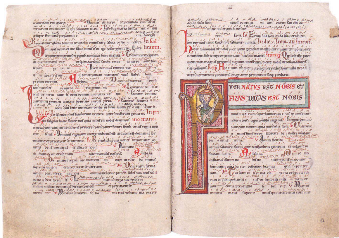
Doppelseite mit dem Propheten Jesaja zu Weihnachten. ZB, Ms. Rh. 14, f. 120/130r.

Dem Widmungsbild vorangestellt ist das Kalendar, welches noch der vertieften Erforschung bedarf. Einen Kalender finden wir in den Handschriften immer dann, wenn das Buch in der Liturgie und im Klosterleben gebraucht wurde. Das Kalenderblatt des Novembers auf f. 8v verzeichnet am 15. November den heiligen Findanus und eine Woche später die Oktav des Heiligenfestes. Gegenüber, auf f. 10r, setzt das Graduale ein mit dem ersten Adventssonntag, der auch der erste Tag des Kirchenjahres ist: «Ad te levavi animam meam», «Deus