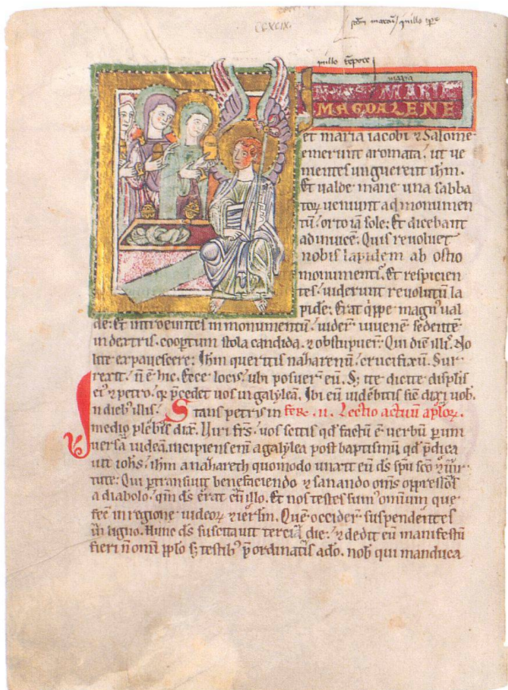
Die drei Frauen vor dem leeren Grab. ZB, Ms. Rh. 14, f. 181v.

nation. Viele Assoziationen stellen sich ein, die eine zum «Beau Dieu» in Reims, Amiens, die andere betrifft den lang ausgestreckten Zeigefinger der rechten Hand. Elias Canetti schreibt 1933: «Versuch über den Finger des Johannes bei Grünewald (es ist der wichtigste Finger der Kunst und