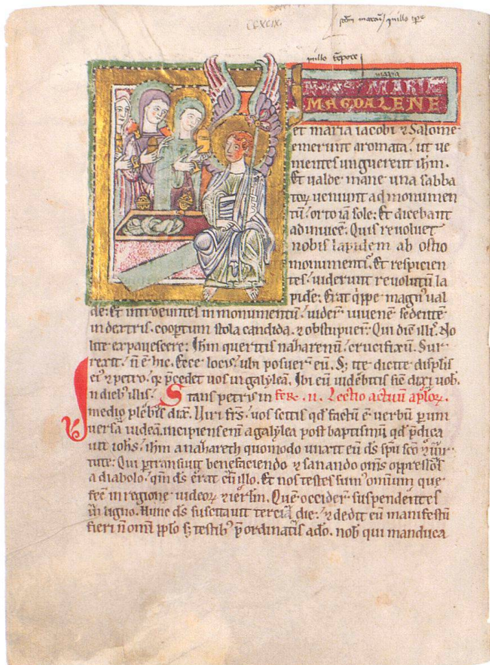
Die drei Frauen vor dem leeren Grab. ZB, Ms. Rh. 14, f. 181v.

nation. Viele Assoziationen stellen sich ein, die eine zum «Beau Dieu» in Reims, Amiens, die andere betrifft den lang ausgestreckten Zeigefinger der rechten Hand. Elias Canetti schreibt 1933: «Versuch über den Finger des Johannes bei Grünewald (es ist der wichtigste Finger der Kunst und