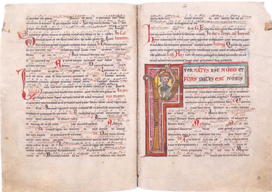
Doppelseite mit dem Propheten Jesaja zu Weihnachten. ZB, Ms. Rh. 14, f. 12v/13r.

Dem Widmungsbild vorangestellt ist das Kalendar, welches noch der vertieften Erforschung bedarf. Einen Kalender finden wir in den Handschriften immer dann, wenn das Buch in der Liturgie und im Klosterleben gebraucht wurde. Das Kalenderblatt des Novembers auf f. 8v verzeichnet am 15. November den heiligen Findanus und eine Woche später die Oktav des Heiligenfestes. Gegenüber, auf f. 10r, setzt das Graduale ein mit dem ersten Adventssonntag, der auch der erste Tag des Kirchenjahres ist: «Ad te levavi animam meam», «Deus