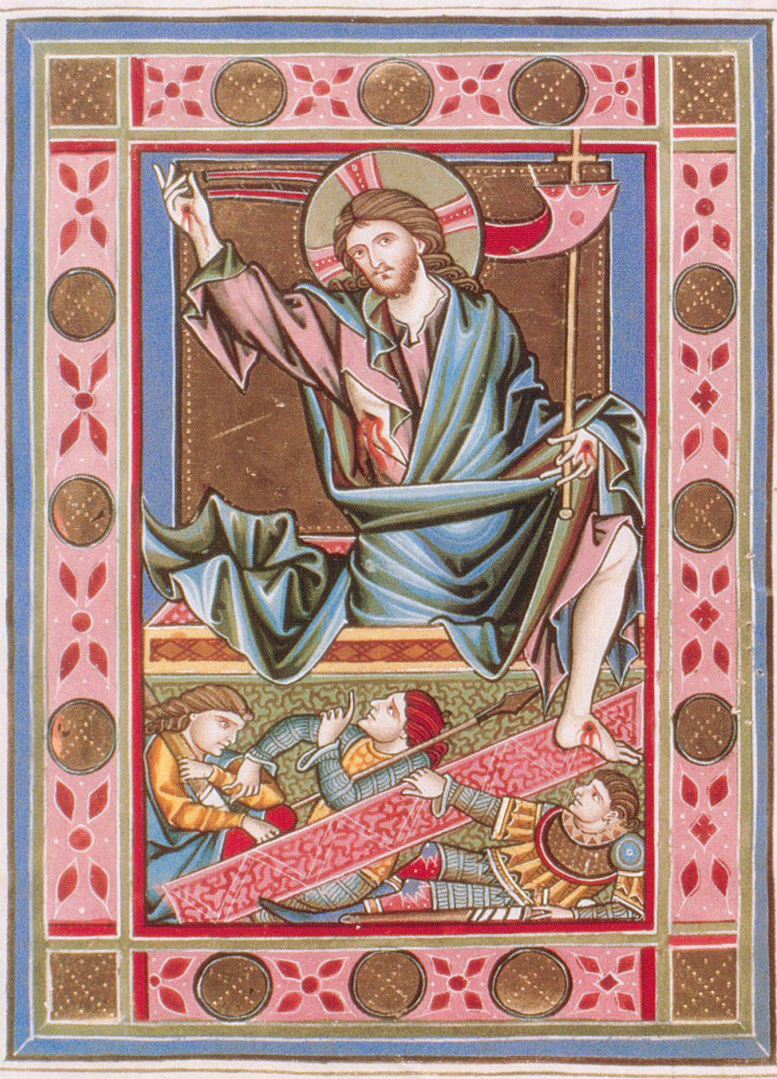
Die Auferstehung Christi in hochgotischer Vollendung. Rheinauer Psalter, ZB, Ms. Rh. 167, f. 107r.