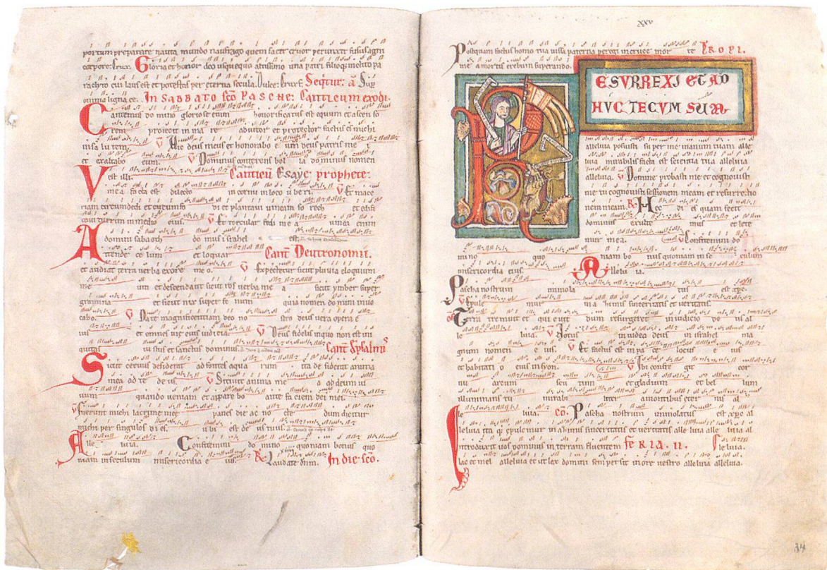
Christus Victor zum Ostersonntag im Graduale. ZB, Ms. Rh. 14, f. 33v/34r.

meus», nach dem ersten Vers des 24. (25.) Psalms. Die Bildinitiale «A» ist ein köstliches Stück Malerei und zeigt den Buchstaben als traubenbehängene Ranke mit einem Christuskopf, erkennbar am Kreuznimbus, und darunter eine Figur mit einer Mauerkrone. Es ist König David, denn er hält ein Spruchband mit Vers 4 des 24. Psalms in Händen: «Vias tuas, Domine, demonstra mihi.» Sehr schön wird so die Verbindung vom Alten und Neuen Testament illustriert, wird die Vorläuferrolle Davids in Szene gesetzt. Die beiden Seiten f. 9v/10r, die sich heute zu einer so prunkvoll wirkenden Doppelseite fügen, gehören verschiedenen Lagen an. Allerdings gibt es keinen Grund, anzunehmen, daß dazwischen etwas fehlen sollte.