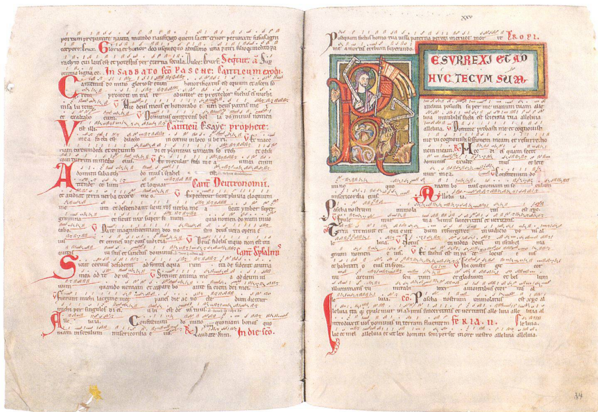
Christus Victor zum Ostersonntag im Graduale. ZB, Ms. Rh. 14, f. 33v/34r.

meus», nach dem ersten Vers des 24. (25.) Psalms. Die Bildinitiale «A» ist ein köstliches Stück Malerei und zeigt den Buchstaben als traubenbehängene Ranke mit einem Christuskopf, erkennbar am Kreuznimbus, und darunter eine Figur mit einer Mauerkrone. Es ist König David, denn er hält ein Spruchband mit Vers 4 des 24. Psalms in Händen: «Vias tuas, Domine, demonstra mihi.» Sehr schön wird so die Verbindung vom Alten und Neuen Testament illustriert, wird die Vorläuferrolle Davids in Szene gesetzt. Die beiden Seiten f. 9v/10r, die sich heute zu einer so prunkvoll wirkenden Doppelseite fügen, gehören verschiedenen Lagen an. Allerdings gibt es keinen Grund, anzunehmen, daß dazwischen etwas fehlen sollte.