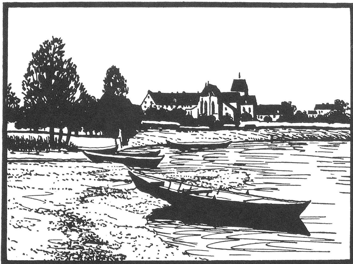
Uferpartie mit ehemaligem Kloster Reichenau, Holzschnitt eines unbekannten Künstlers, aus «Reichenauer Kunst», Heimatblätter, herausgegeben von Konrad Gröber, Verlag C. F. Müller, Karlsruhe 1924 (Illustration aus der Menükarte unserer Jahrestagung).

diesem Tag wegen des gleichzeitig stattfindenden Kulturfestes geschlossen war. Diese Schätze waren entgegenkommenderweise für die Bibliophilen für einen Tag ins Stadtarchiv ausgeliehen worden.