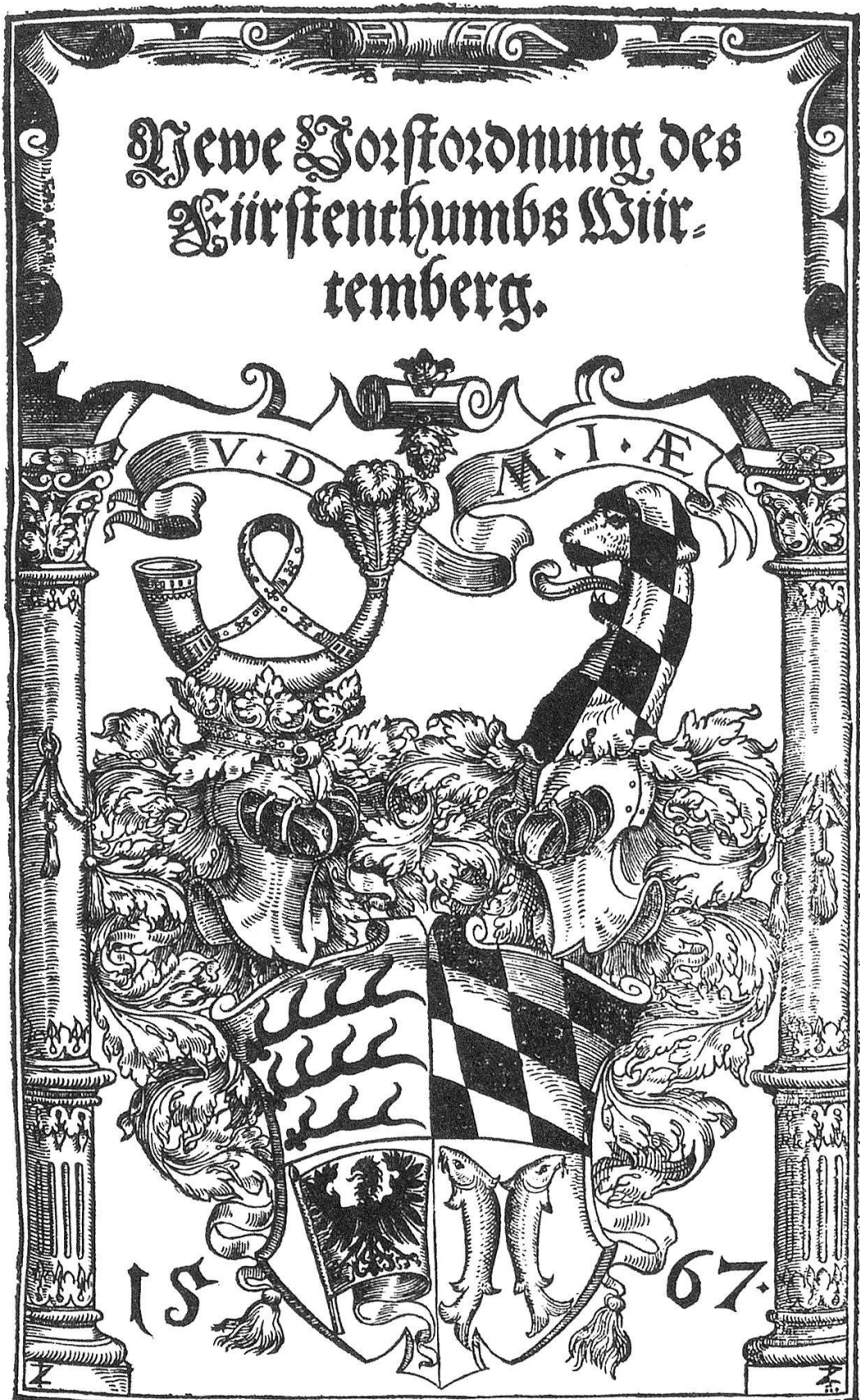
«Neue Vorstordnung des Fürstenthumbs Württemberg.» O.O. 1567. Charakteristisch ist die Abbildung des landesherrlichen Wappens. Herzog August Bibliothek Wolfenbüttel.