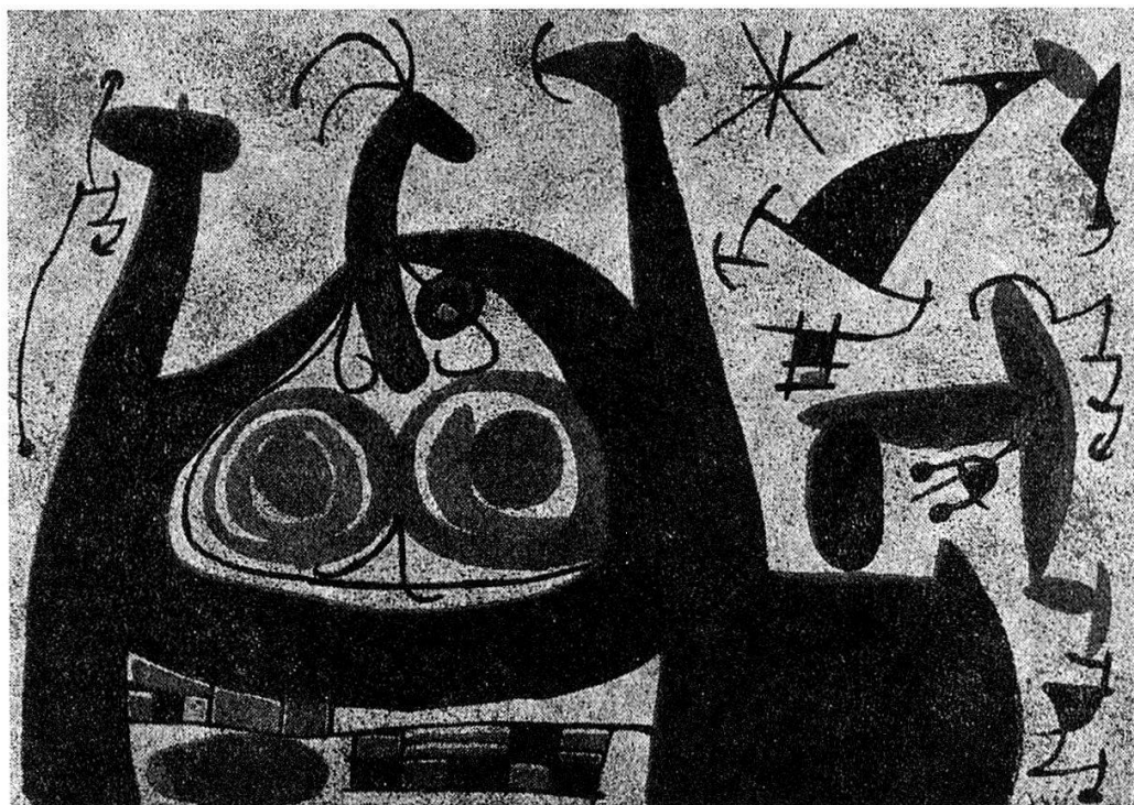
Joan Miró: Le Lézard aux plumes d'or – 13 Original-Farblithographien zu Texten von Miró Das Buch ist im Druckvermerk von Miró handsigniert