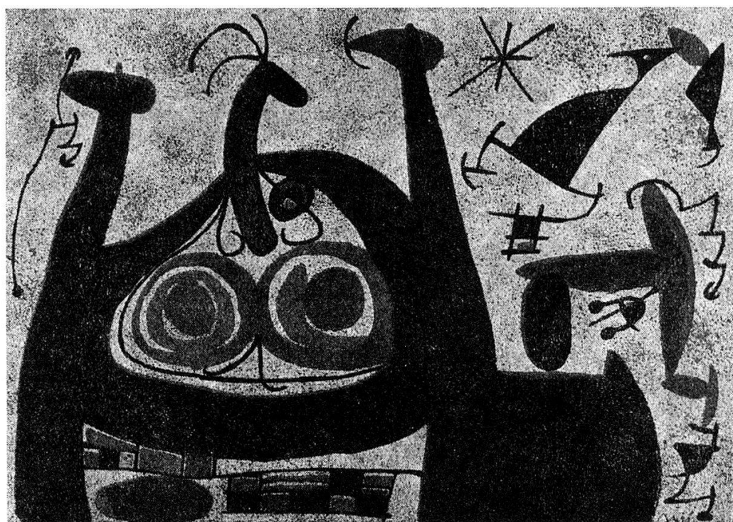
Joan Miró: Le Lézard aux plumes d'or – 13 Original-Farblithographien zu Texten von Miró Das Buch ist im Druckvermerk von Miró handsigniert