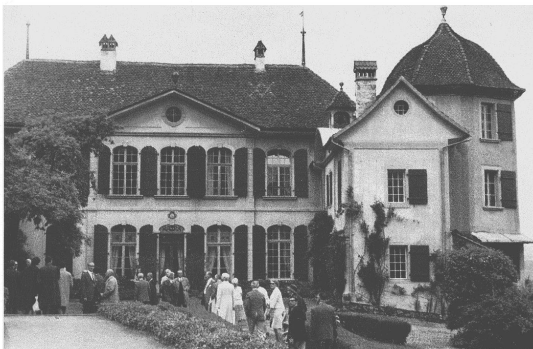
Schloß Toffen im Gürbetal mit seiner reizvollen, im Turme rechts untergebrachten Bibliothek