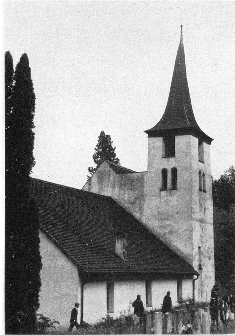
Die eine Gruppe der Teilnehmer besuchte auf dem Weg nach Toffen die malerisch gelegene Kirche von Blumenstein