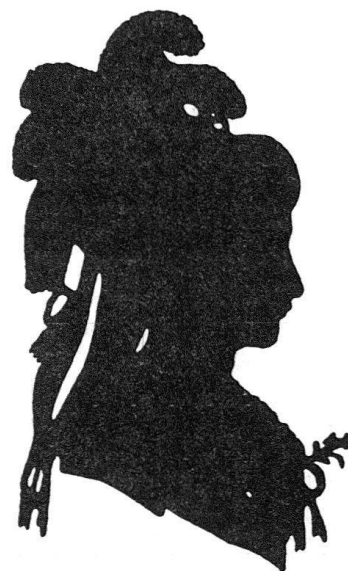
Abbildung zu Katalognummer 12.