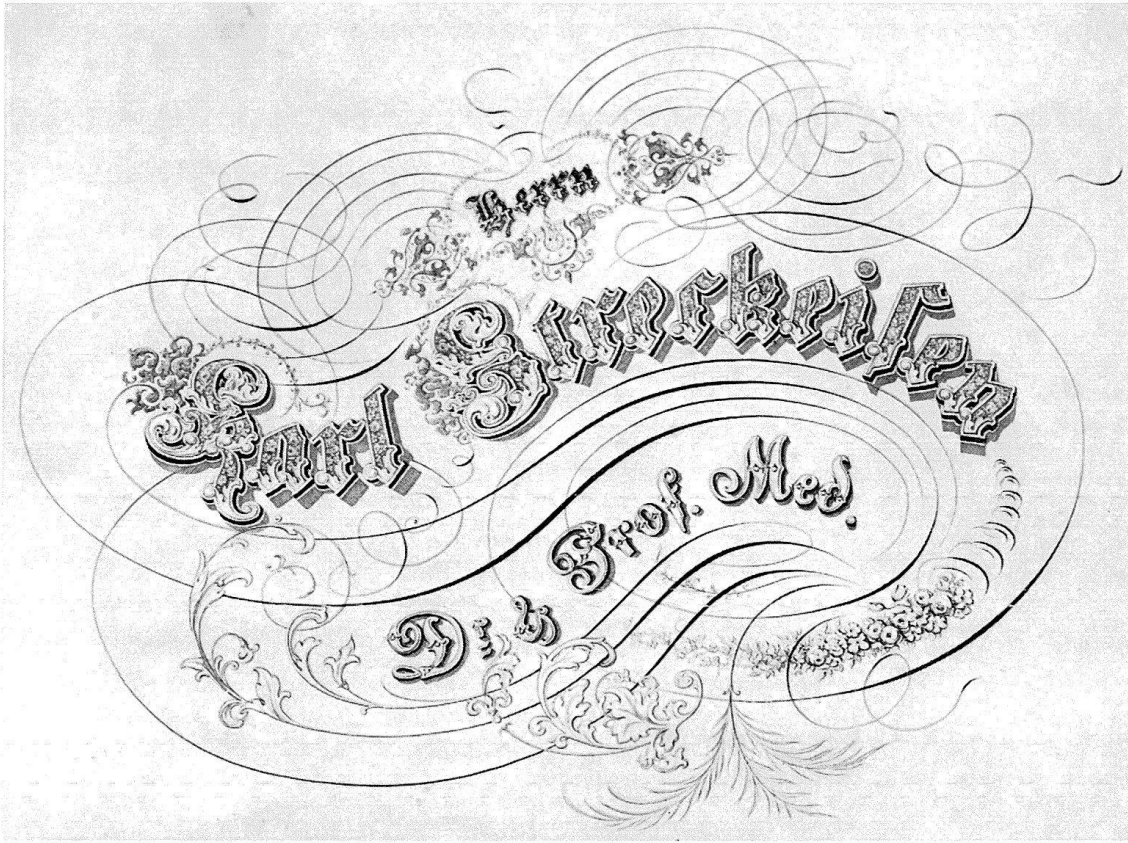
Abb. 2 (stark verkleinert). Das liebevoll ausgeführte Widmungsblatt.

es als Ehrenpflicht betrachtet, sich der neuen Verwandtschaft würdig zu erweisen. Schon kurz nach seiner Vermählung legte er für seinen Schwager, den Mediziner, für den er eine tiefe Verehrung gehabt haben muß, eine Streckeisensche Familienchronik an. Ob er sich beim Beginn seiner Arbeit wohl einen Begriff davon gemacht hat, welche Fron er sich damit aufstufte? Während seiner zweiten Lebenshälfte muß er der begonnenen Aufgabe jede Mußestunde geopfert haben.