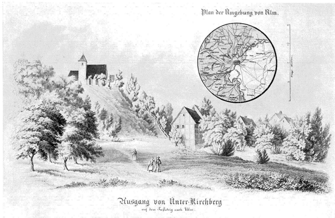
Abb. 3 (stark verkleinert). Die vom Verfasser der Chronik entdeckte Stammheimat des Basler Geschlechts; im Kreise ein aufgeklebtes Stück aus einer Landkarte.

und mit zierlichen Kranzgewinden behängt. Selbst zwei eigene Entwürfe für Siegel sind beigegeben, heraldisch unmöglich (auch die Heroldskunde war in jener Zeit ein Stiefkind der Kunst), aber mit bemerkenswerter Fertigkeit. Hübsch ist die peinlich genaue Darstellung von Unter-Kirchberg bei Ulm, das wohl von Geelhaar als ursprüngliche Heimat der Familie entdeckt wurde, nachdem man bis dahin Kurzrickenbach im Thurgau als solche angenommen hatte 1 .